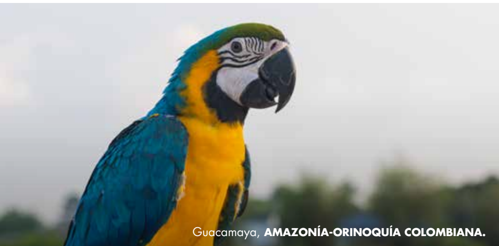
Guacamaya, AMAZONÍA-ORINOQUÍA COLOMBIANA.

Se aprecia desde los cerros y nos invita a regresar a lo simple.