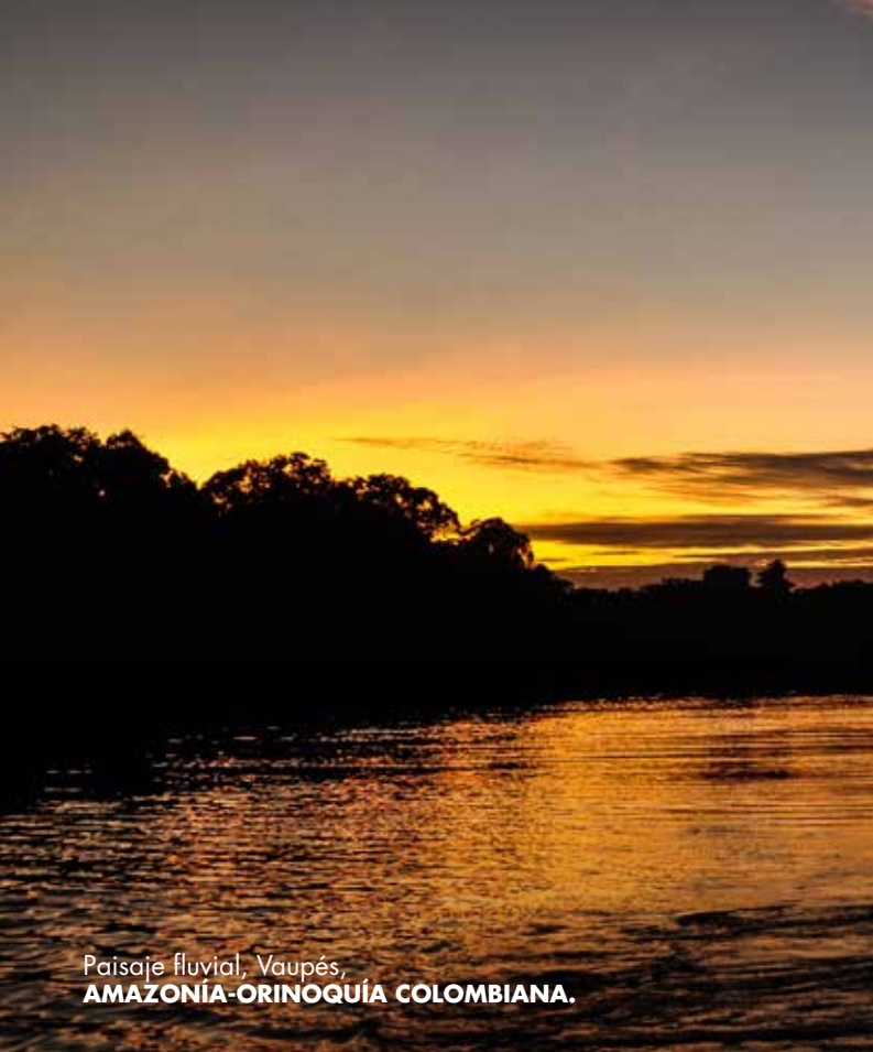
Paisaje fluvial, Vaupés, AMAZONÍA-ORINOQUÍA COLOMBIANA.