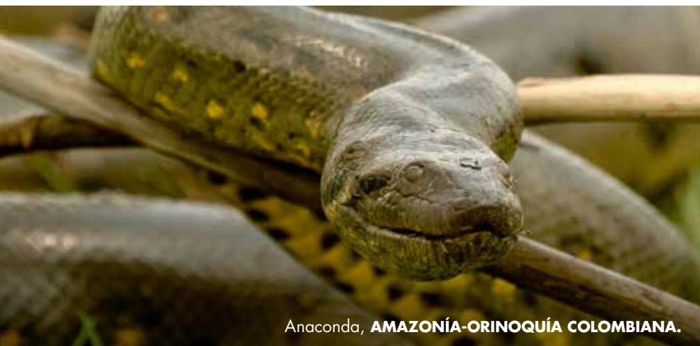
Anaconda, AMAZONÍA-ORINOQUÍA COLOMBIANA.

Incontables aves, animales terrestres y fuentes hídricas en la inmensidad de la selva.