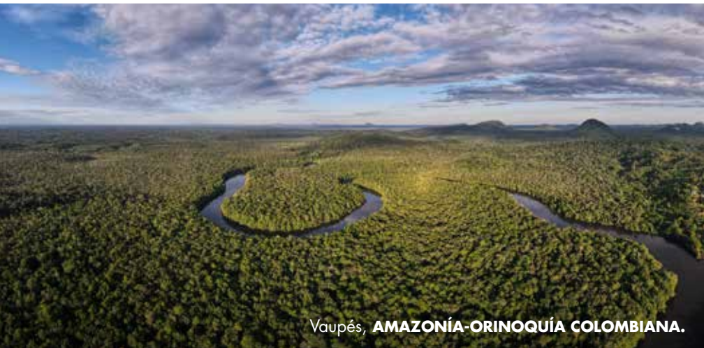
Vaupés, AMAZONÍA-ORINOQUÍA COLOMBIANA.