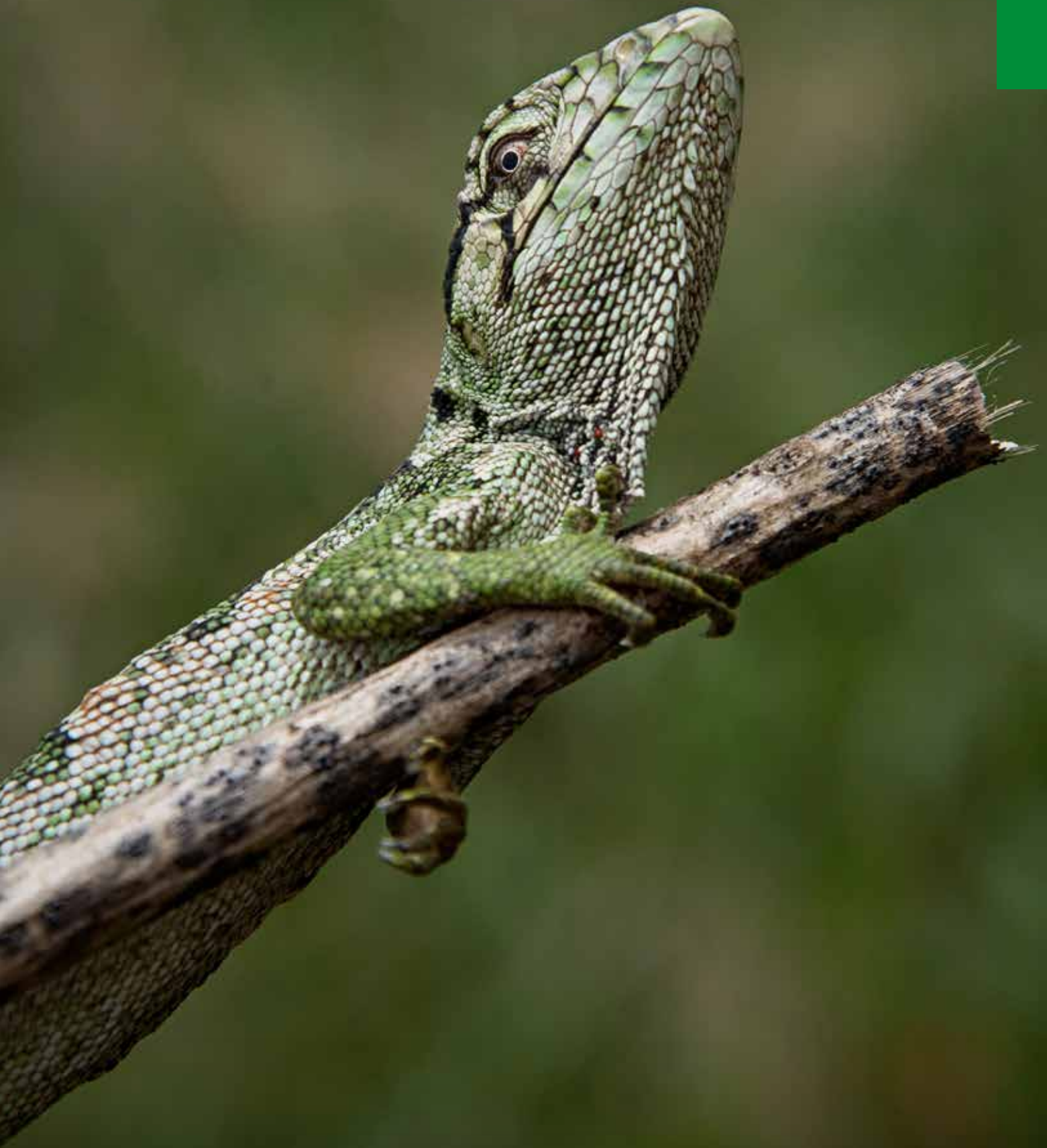
Iguana, AMAZONÍA-ORINOQUÍA COLOMBIANA.