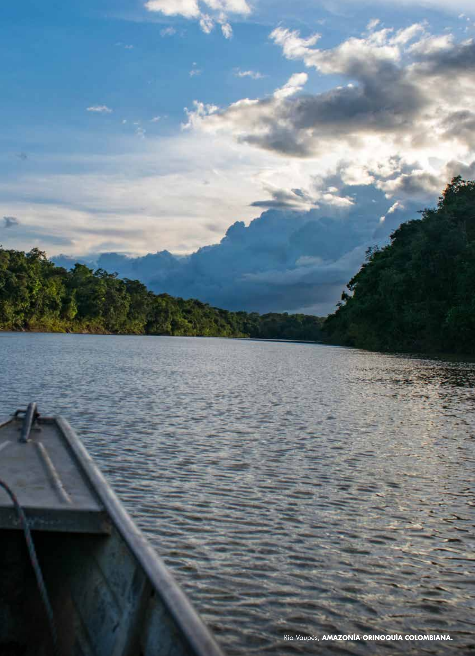
Río Vaupés, AMAZONÍA-ORINOQUÍA COLOMBIANA.