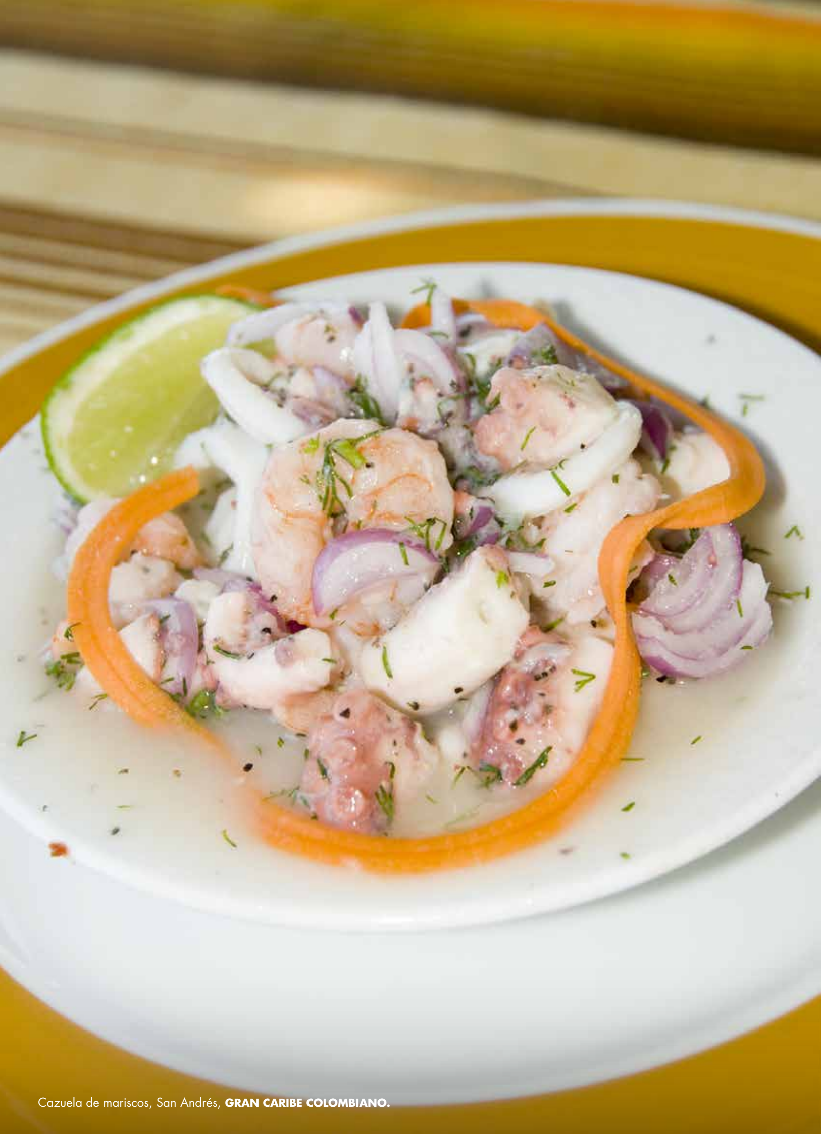
Cazuela de mariscos, San Andrés, GRAN CARIBE COLOMBIANO .