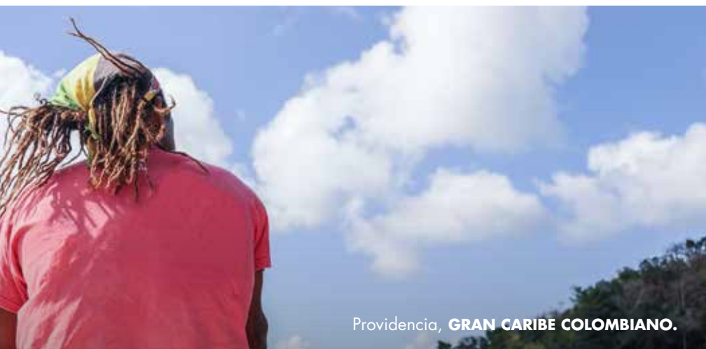
Providencia, GRAN CARIBE COLOMBIANO.

El comercio es un tema recurrente en la historia del archipiélago, ligado a las colonias europeas, los piratas, la industria del coco y hasta su proclamación como puerto libre.