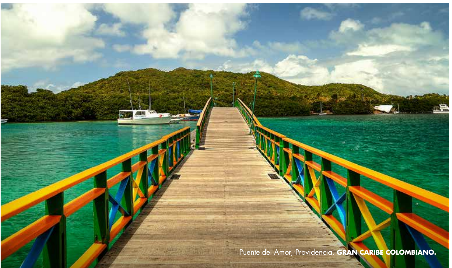
Puente del Amor, Providencia, GRAN CARIBE COLOMBIANO.