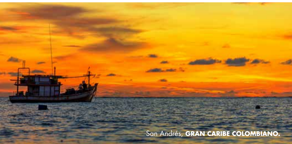
San Andrés, GRAN CARIBE COLOMBIANO.

Es una región cuya geografía invita a interactuar con el mar, las playas, la fauna marina y su biodiversidad.