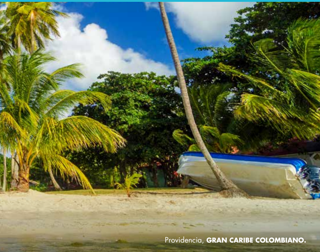
Providencia, GRAN CARIBE COLOMBIANO .