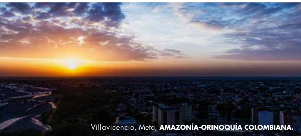
Villavicencio, Meta, AMAZONÍA-ORINOQUÍA COLOMBIANA.

El caballo representa el motor del llanero, el compañero de travesías, hazañas y aventuras.