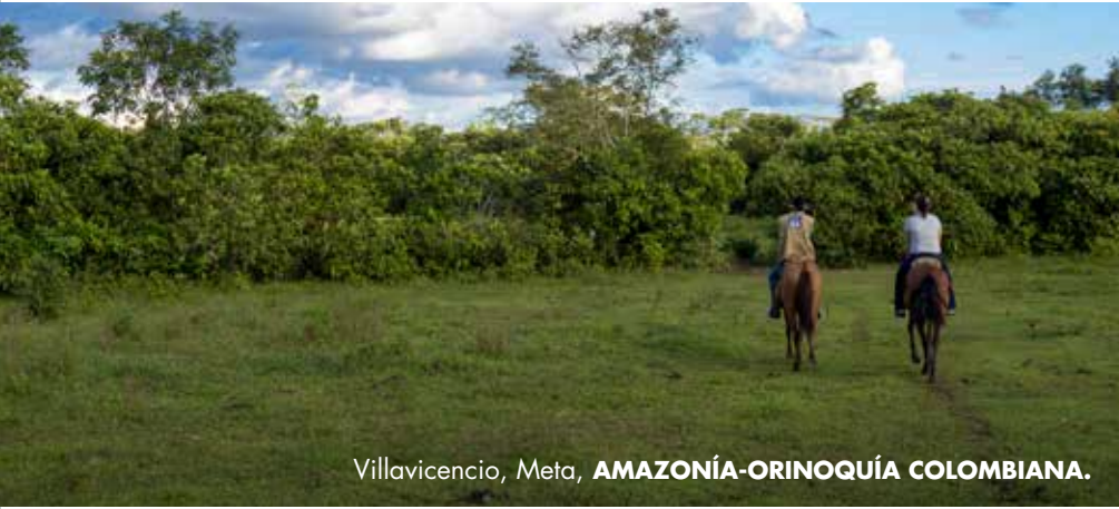
Villavicencio, Meta, AMAZONÍA-ORINOQUÍA COLOMBIANA.