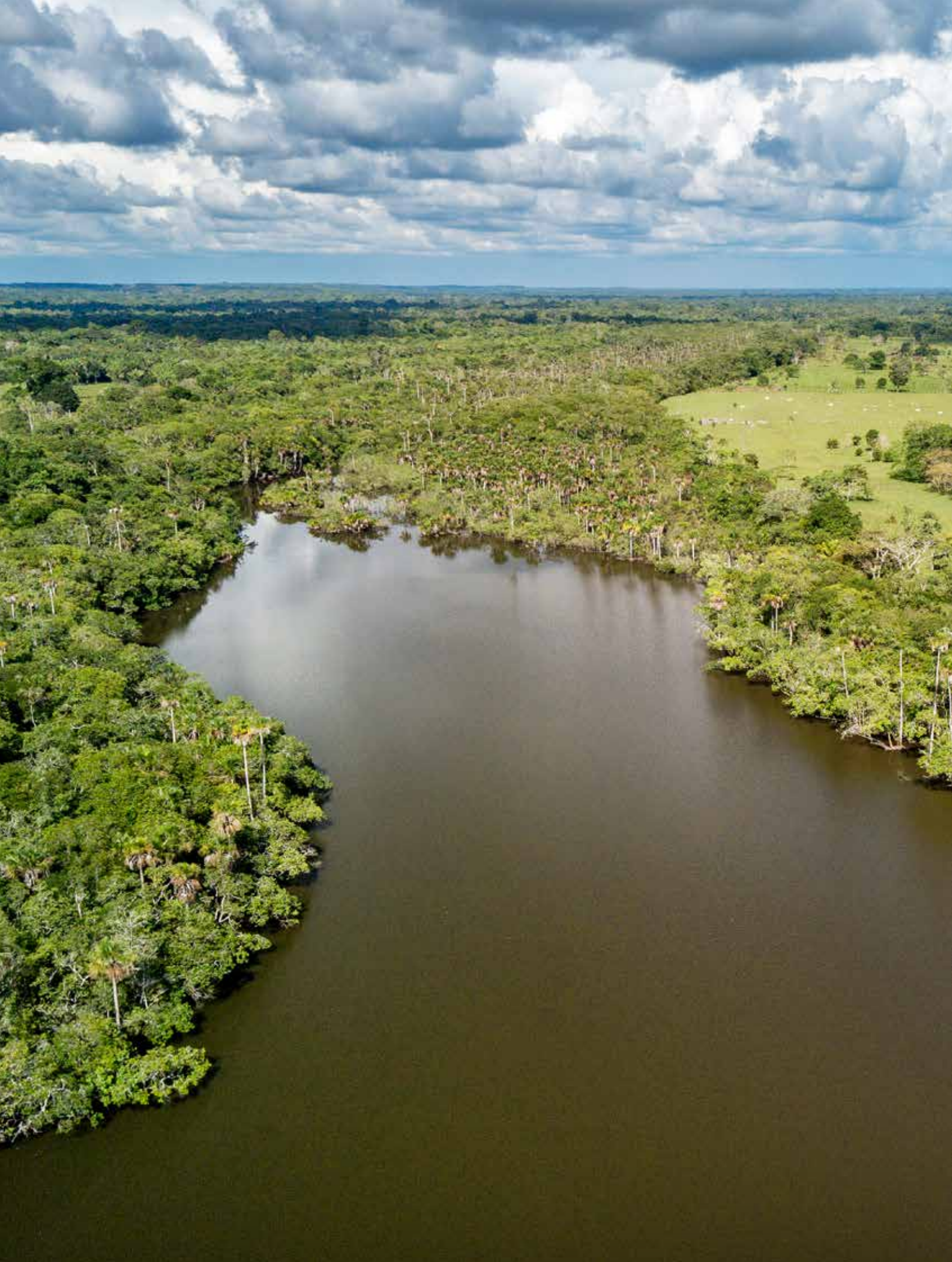
Laguna del Silencio, Meta, AMAZONÍA-ORINOQUÍA COLOMBIANA.