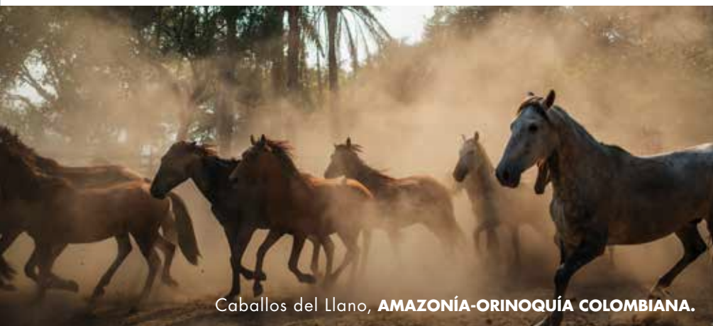
Caballos del Llano, AMAZONÍA-ORINOQUÍA COLOMBIANA.

Es el referente de la biodiversidad del departamento y del país, tanto en el territorio nacional como para el resto del mundo.