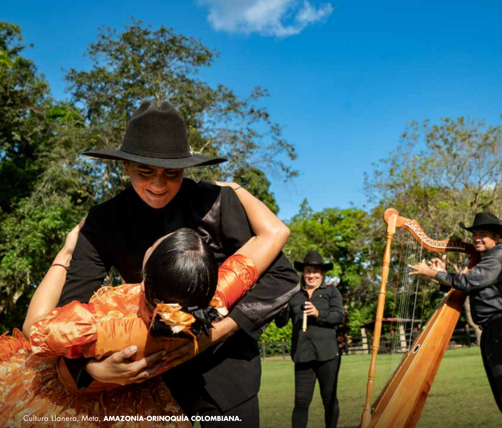
Cultura Llanera, Meta, AMAZONÍA-ORINOQUÍA COLOMBIANA.