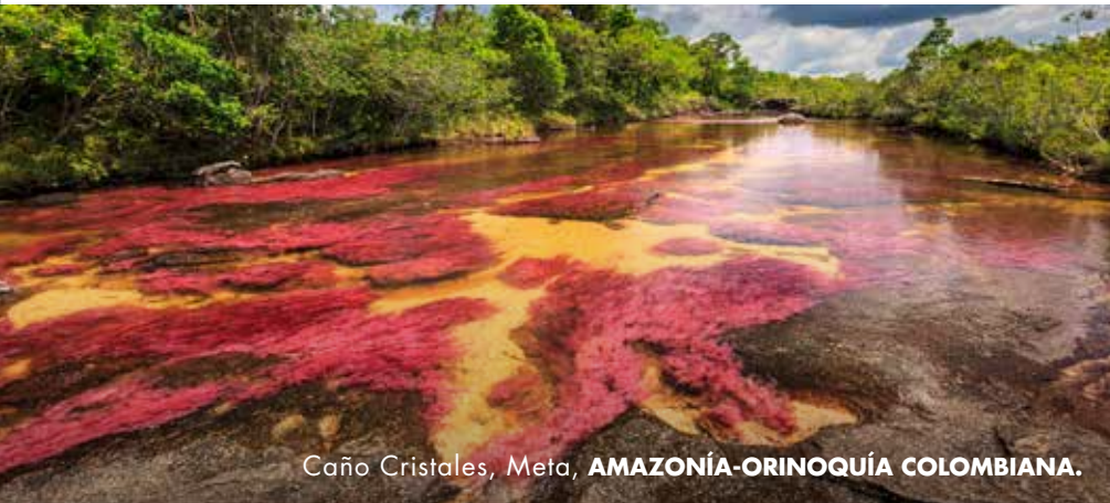
Caño Cristales, Meta, AMAZONÍA-ORINOQUÍA COLOMBIANA.

El departamento se piensa a sí mismo como la puerta de la Orinoquía y de allí juega su papel protagónico para el desarrollo comercial de la región.