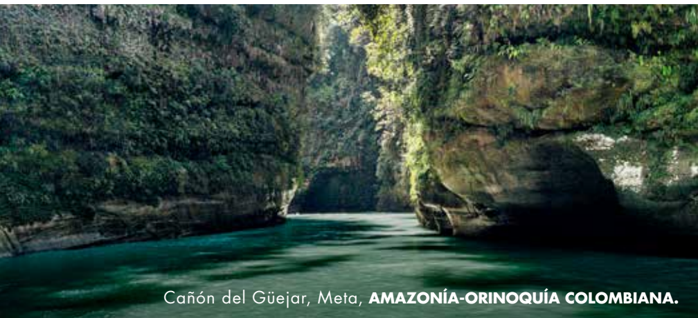
Cañón del Güejar, Meta, AMAZONÍA-ORINOQUÍA COLOMBIANA.