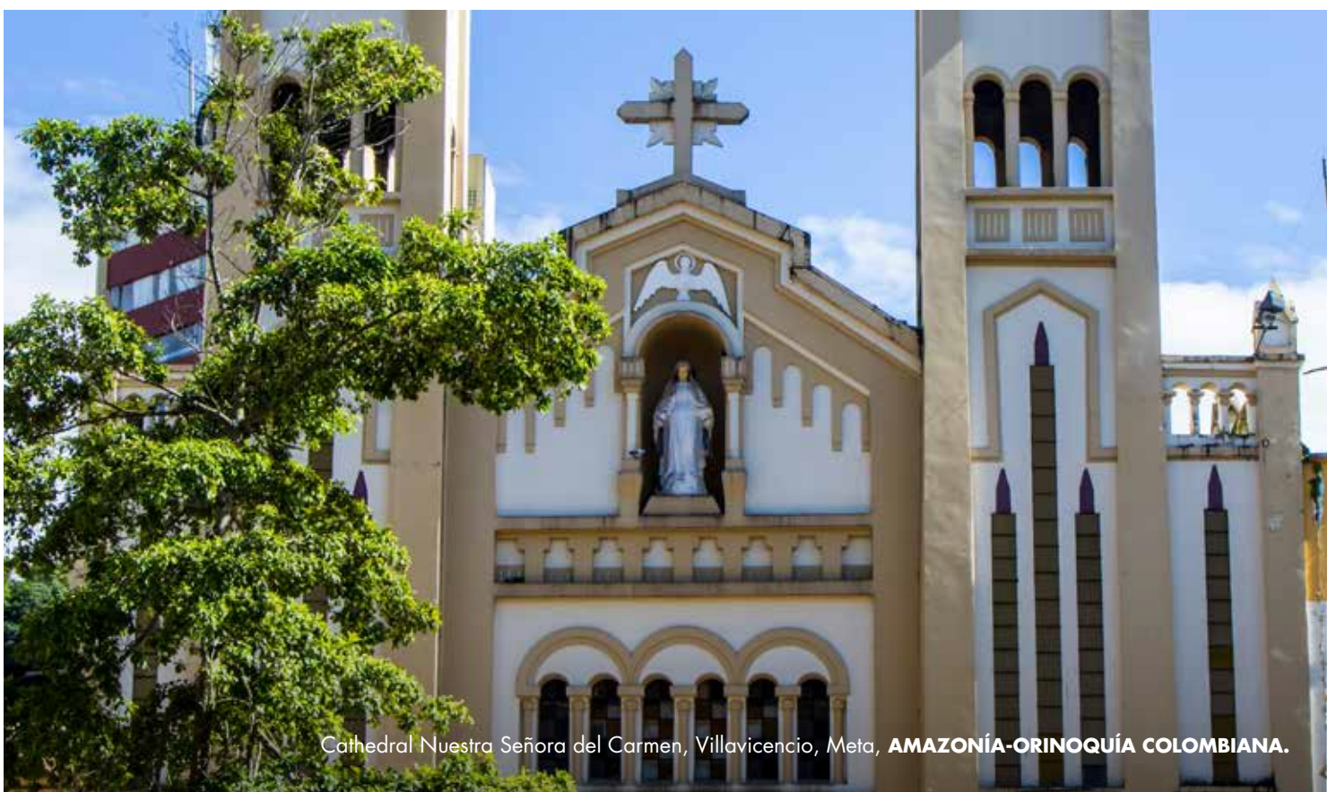
Catedral Nuestra Señora del Carmen, Villavicencio, Meta, AMAZONÍA-ORINOQUÍA COLOMBIANA.