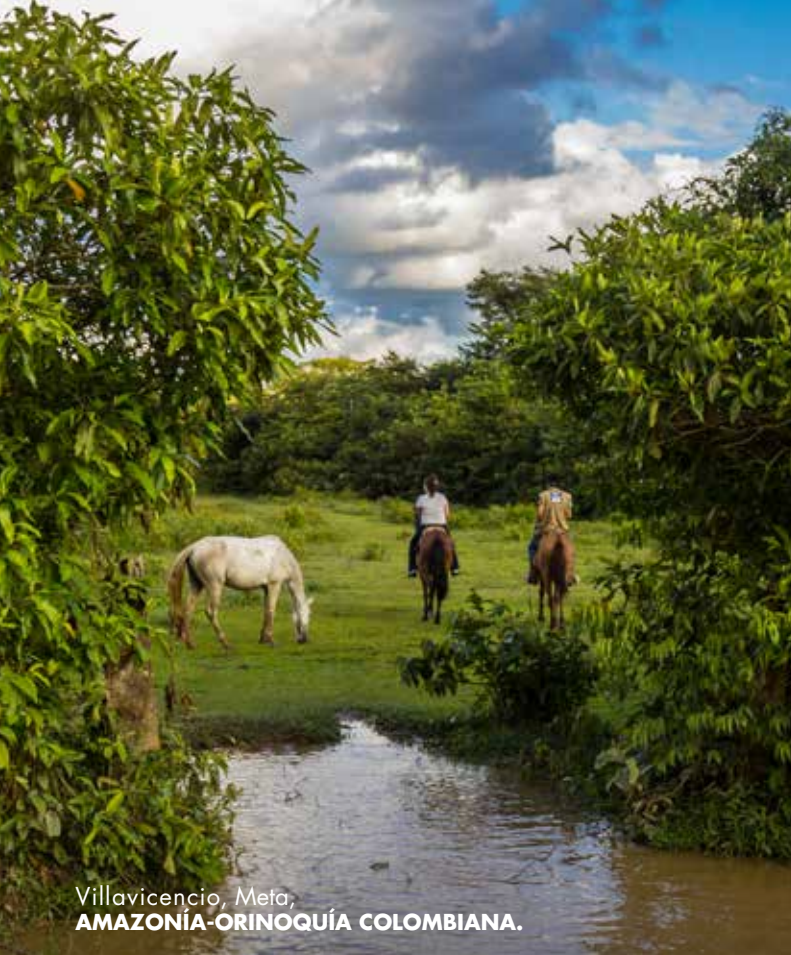
Villavicencio, Meta, AMAZONÍA-ORINOQUÍA COLOMBIANA.