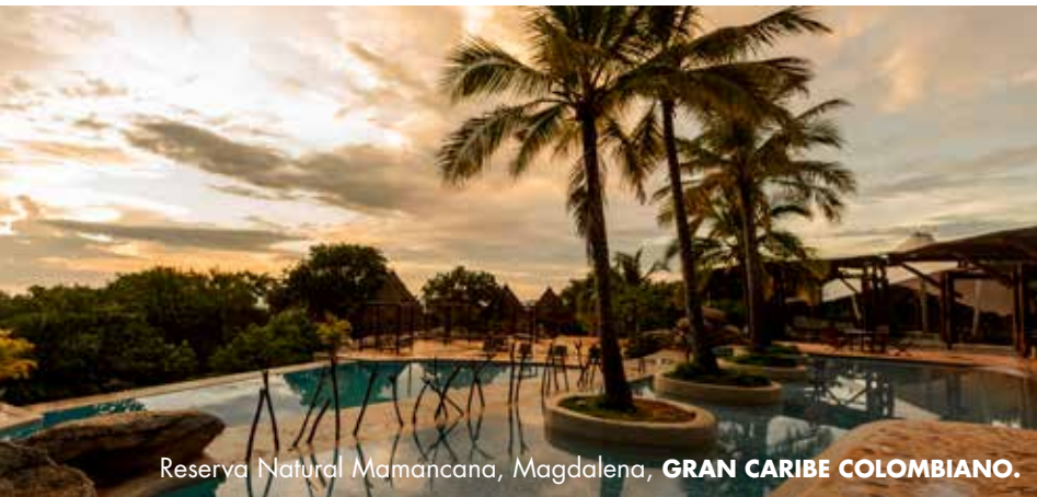
Reserva Natural Mamancana, Magdalena, GRAN CARIBE COLOMBIANO.

Representante de la mezcla del departamento y base musical del país.