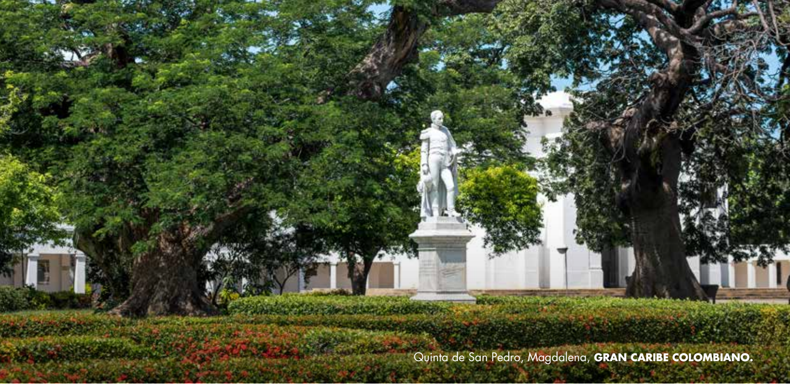
Quinta de San Pedro, Magdalena, GRAN CARIBE COLOMBIANO.