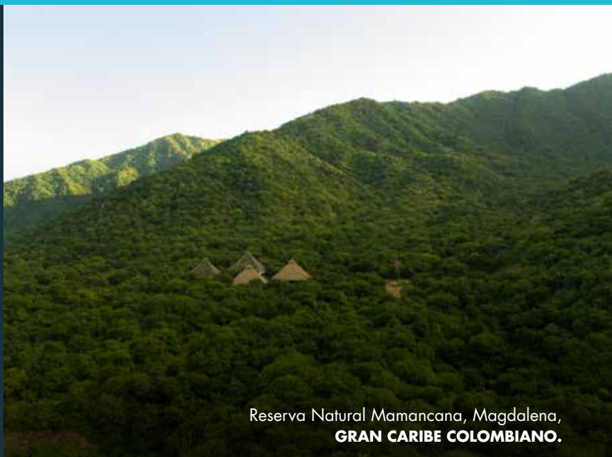
Reserva Natural Mamancana, Magdalena, GRAN CARIBE COLOMBIANO.