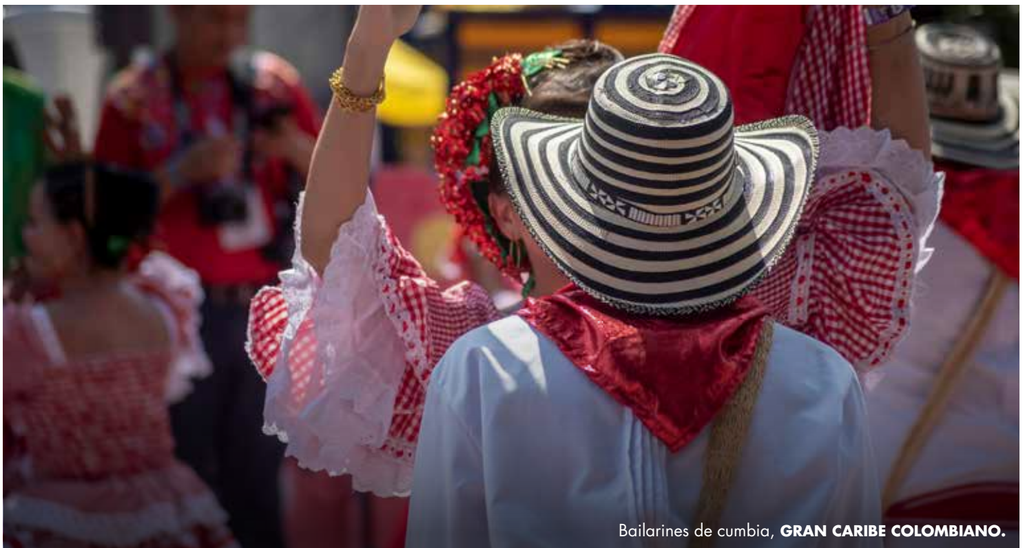
Bailarines de cumbia, GRAN CARIBE COLOMBIANO.

Magdalena es un lugar de geografías inmensas que resguardan culturas de sierras, aguas dulces y saladas, y las cruza para formar una mezcla de sabores, colores y folclores representadas en un increíble realismo mágico.