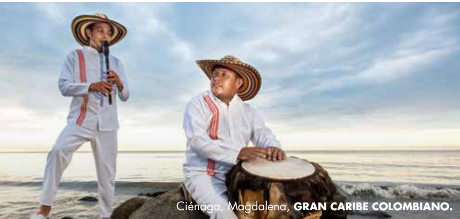
Ciénaga, Magdalena, GRAN CARIBE COLOMBIANO.