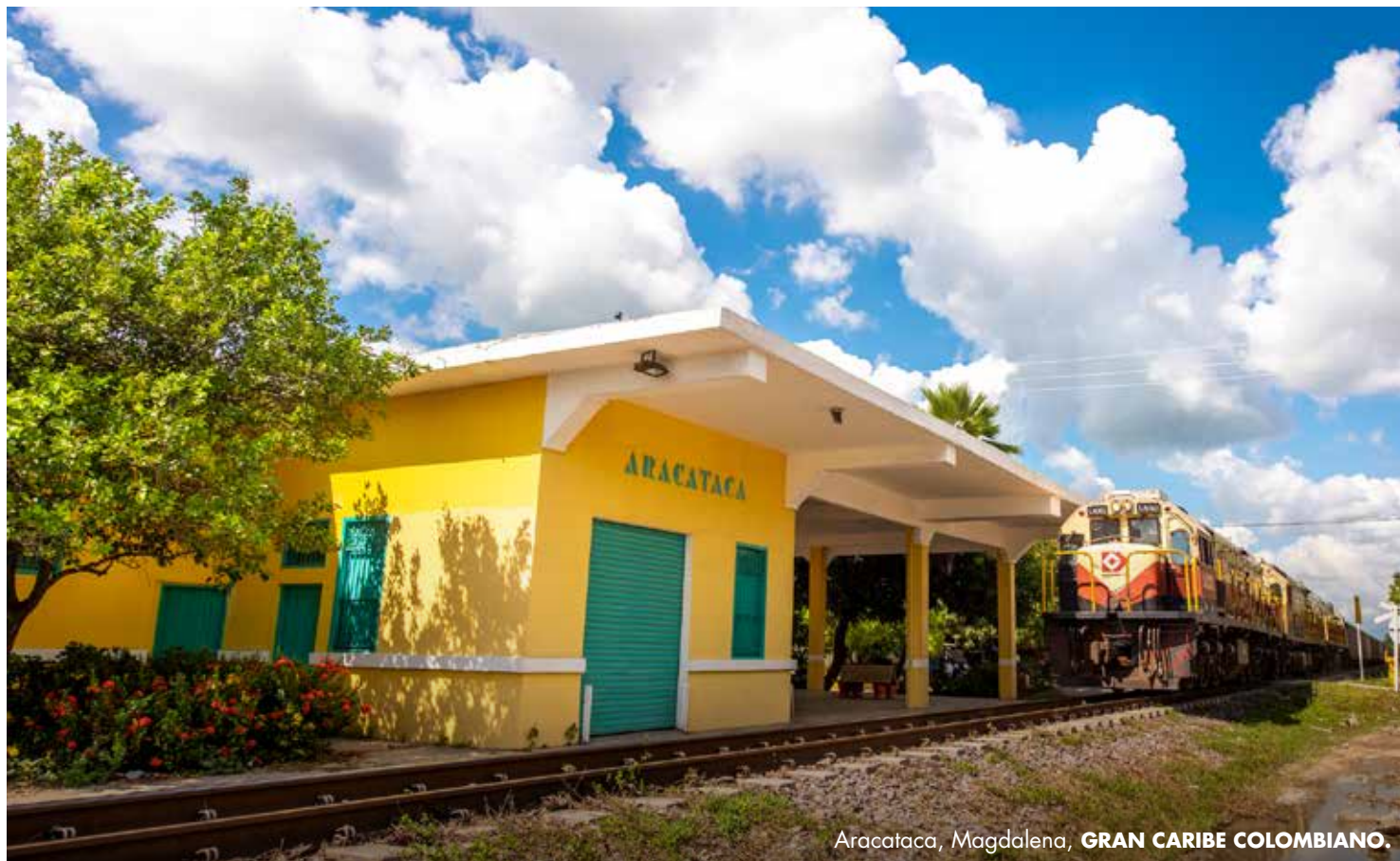
Aracataca, Magdalena, GRAN CARIBE COLOMBIANO.

La llegada de diversas culturas, el comercio y el ferrocarril llevaron al departamento vida, comercio y personas de distintos lugares.