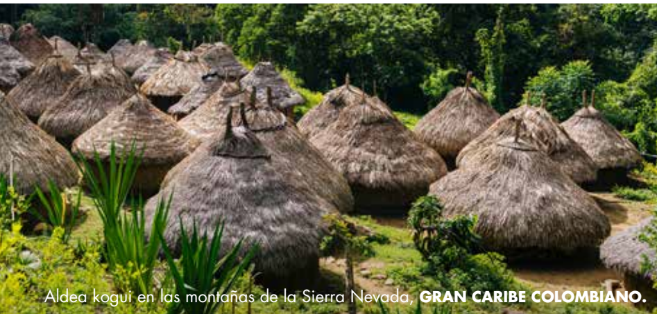
Aldea kogui en las montañas de la Sierra Nevada, GRAN CARIBE COLOMBIANO.

El tiempo pasa lento para poder disfrutar los amañeres, atardeceres y las comidas.