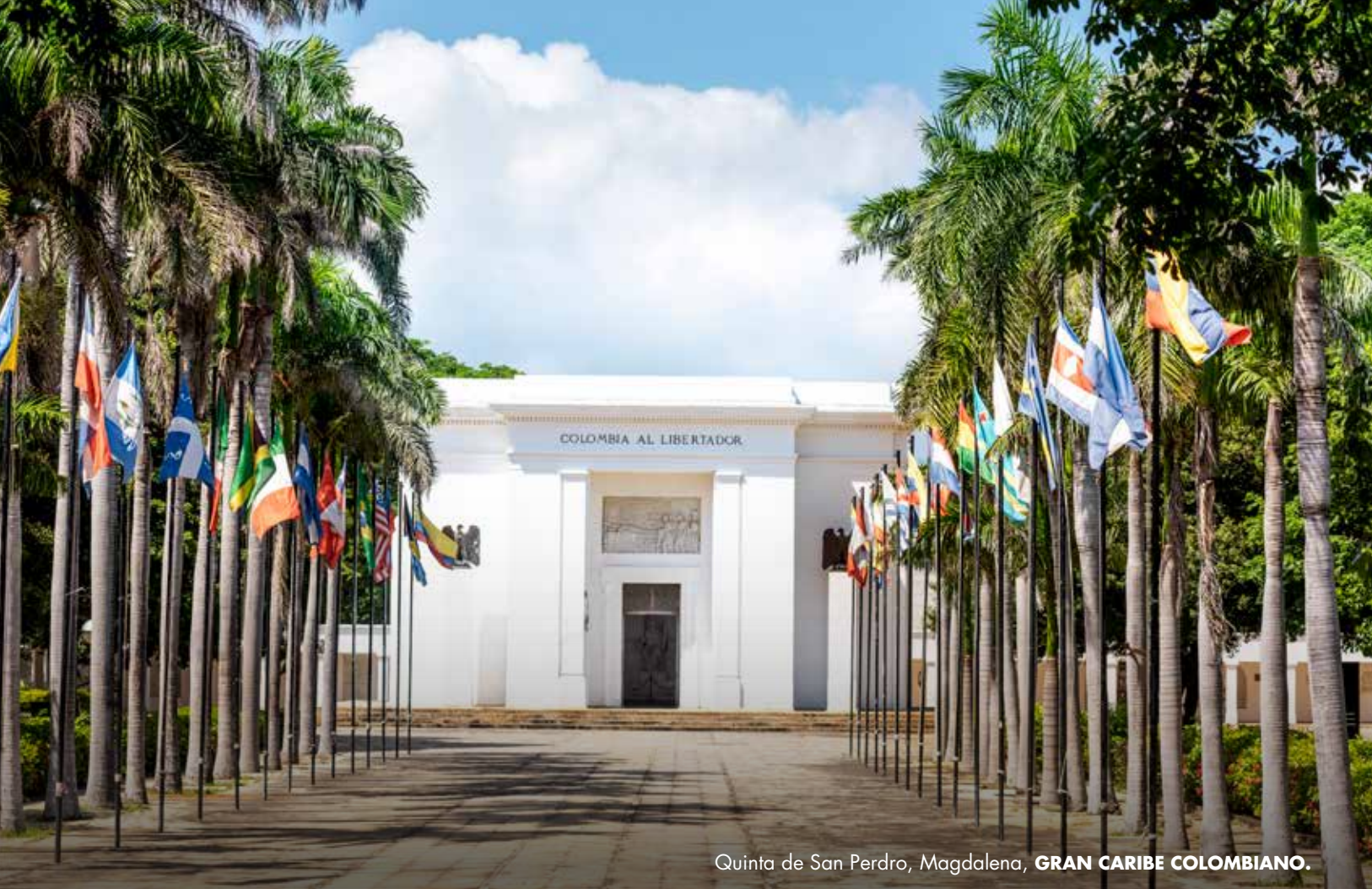
Quinta de San Pedro, Magdalena, GRAN CARIBE COLOMBIANO.