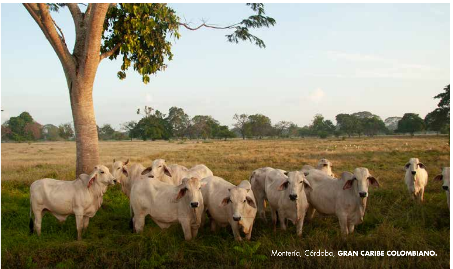
Montería, Córdoba, GRAN CARIBE COLOMBIANO .