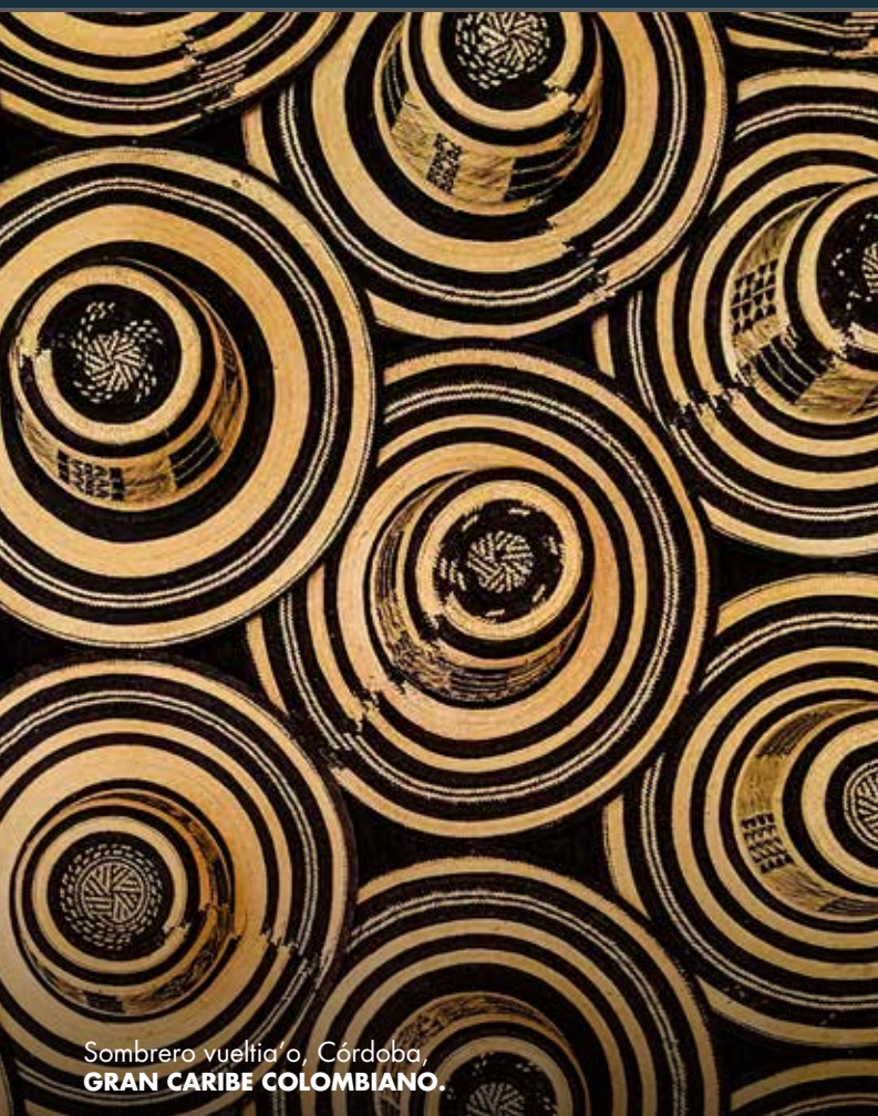
Sombrero vueltiao, Córdoba, GRAN CARIBE COLOMBIANO.