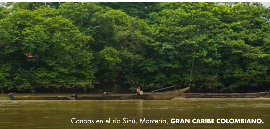
Canoas en el río Sinú, Montería, GRAN CARIBE COLOMBIANO.

Un territorio de tradiciones y de historia que permanece en su arquitectura. Es un lugar en el que la literatura es relevante en tanto aporta fuerza y riqueza a la mezcla.