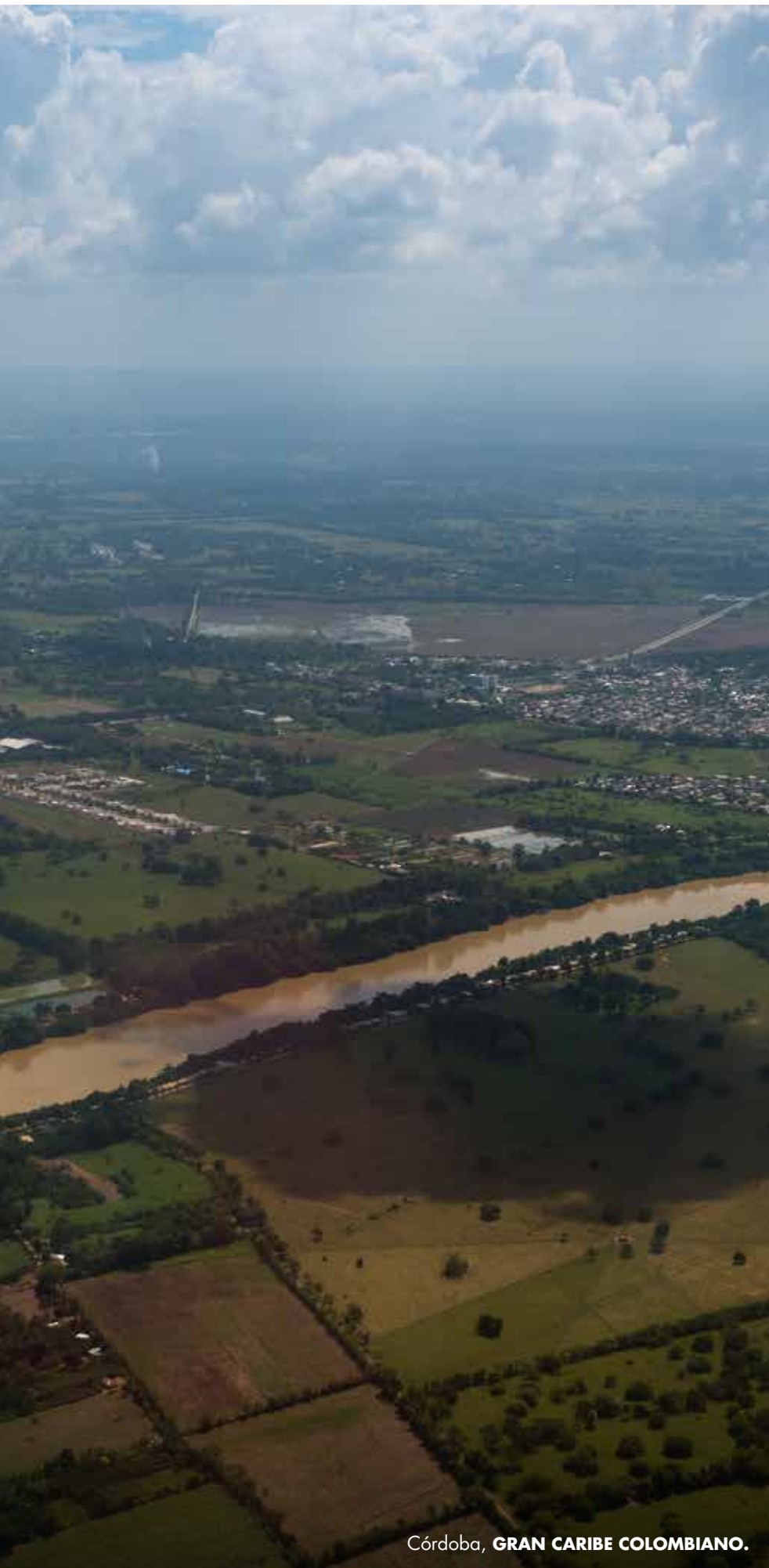
Córdoba, GRAN CARIBE COLOMBIANO.

Testimonios anónimos revelan que “la cordillera occidental muere aquí, en el Nudo de Paramillo, y ahí se dividen tres serranías: Ayapel, San Jerónimo y Abibe. Todas entran al departamento, teniendo una serie de colinas y cerros que también le varían el paisaje. Esto hace que en nuestra orilla de mar no tengamos playas arenosas como Coveñas, sino acantilados más pequeños. Hay playas, pero también muchos acantilados pequeños, porque encuentras la montaña y el mar. Esto es otro paisaje, la gente no está acostumbrada, porque piensa en costa, y piensa en playas” .