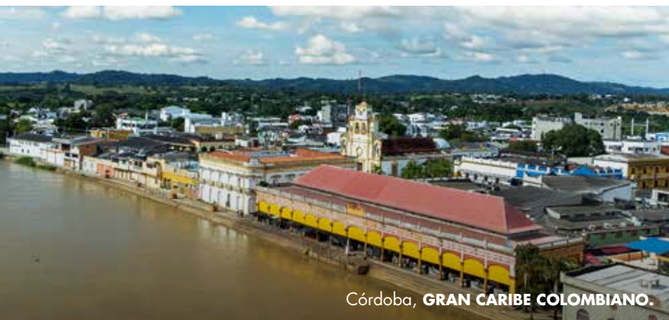
Córdoba, GRAN CARIBE COLOMBIANO.

Sus creaciones en caña flecha, especialmente el sombrero vueltaio representan al cordobés. Este accesorio se convierte en una extensión más de su cuerpo, es el que lo acompaña y lo cuida del sol.