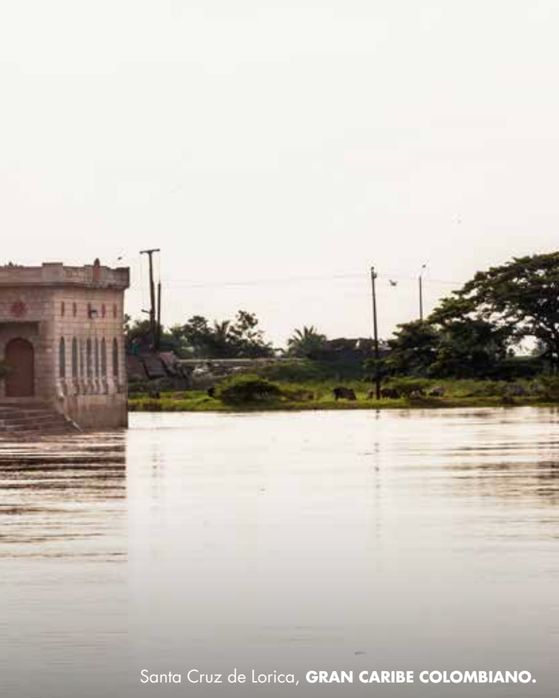
Santa Cruz de Lorica, GRAN CARIBE COLOMBIANO.

“Entonces, esa multiculturalidad producto de la mezcla que proviene también de la ancestralidad y de la penetración de diferentes culturas; El indígena con el español, el africano y los extranjeros provenientes de otros países. En este caso, los que mas pasaban eran los Sirios-libaneses, por eso se habla de que Córdoba tiene cuatro grandes herencias, atiende a los indígenas, españoles, africanos y Sirio-libaneses”.