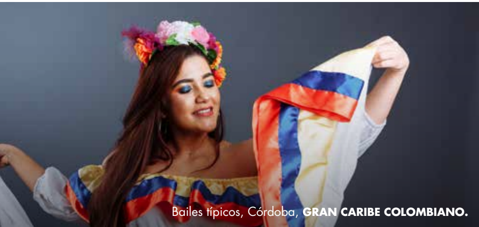
Bailes típicos, Córdoba, GRAN CARIBE COLOMBIANO.