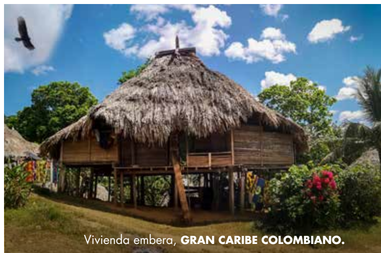
Vivienda embera, GRAN CARIBE COLOMBIANO.

En Córdoba se encuentran los palenques, símbolo de fuerza y resistencia. Por otro lado, la cultura negra entrega en Córdoba el bullerengue, baile que nace de los cantos palenqueros y está acompañado de cantoras, bailadoras y tamboreros.