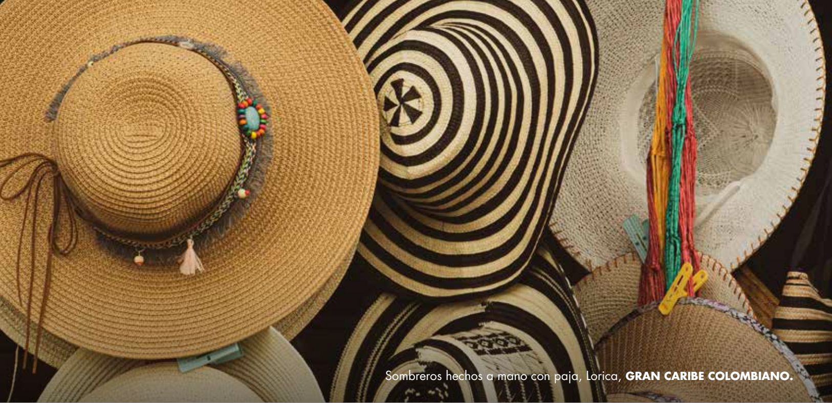
Sombreros hechos a mano con paja, Loricá, GRAN CARIBE COLOMBIANO .