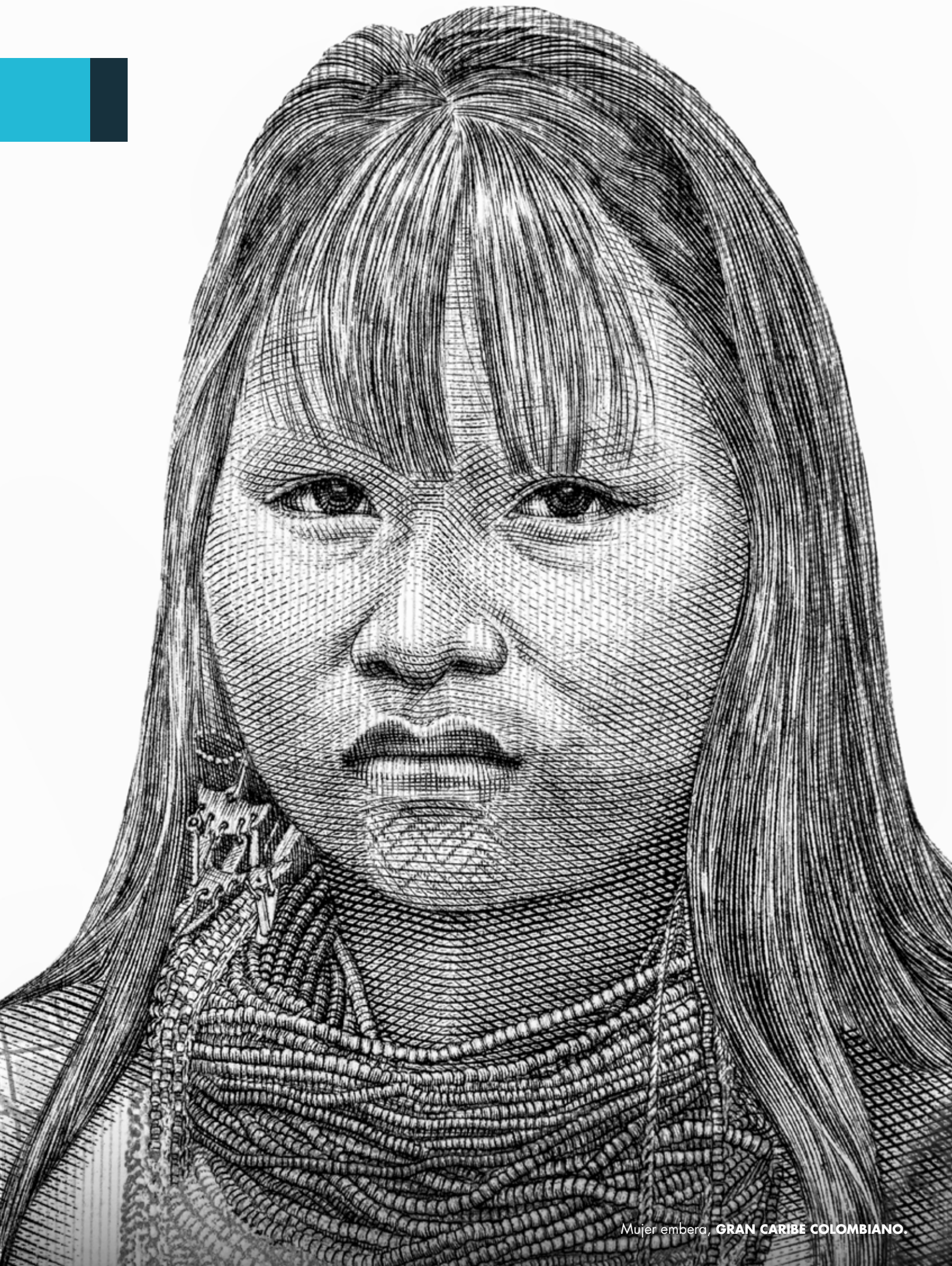
Mujer embera, GRAN CARIBE COLOMBIANO.