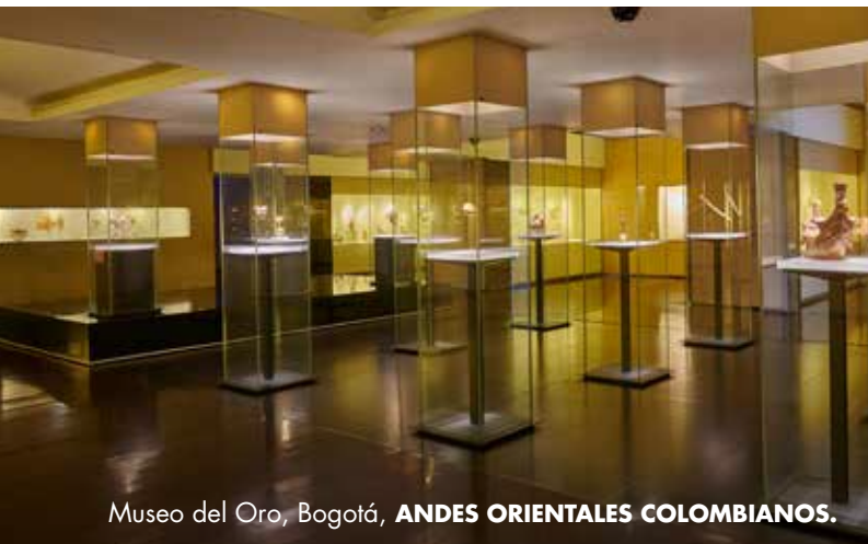
Museo del Oro, Bogotá, ANDES ORIENTALES COLOMBIANOS.

Ser irreverente es ir en contra de la "norma", es decir, ser disruptivo, salirse de lo tradicional. Los festivales y las diferentes expresiones artísticas en Bogotá, así como las tribus urbanas, nos muestran una ciudad donde la irreverencia se hace presente. Es el llamado de la ciudad a pensar diferente.