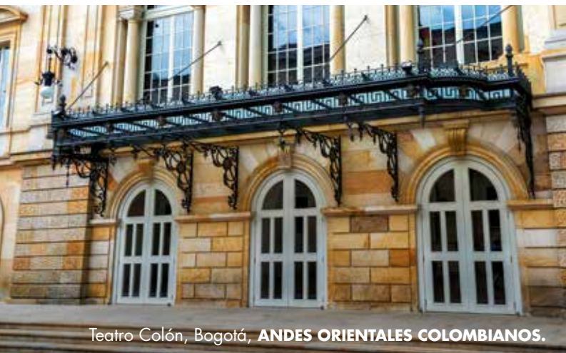
Teatro Colón, Bogotá, ANDES ORIENTALES COLOMBIANOS.