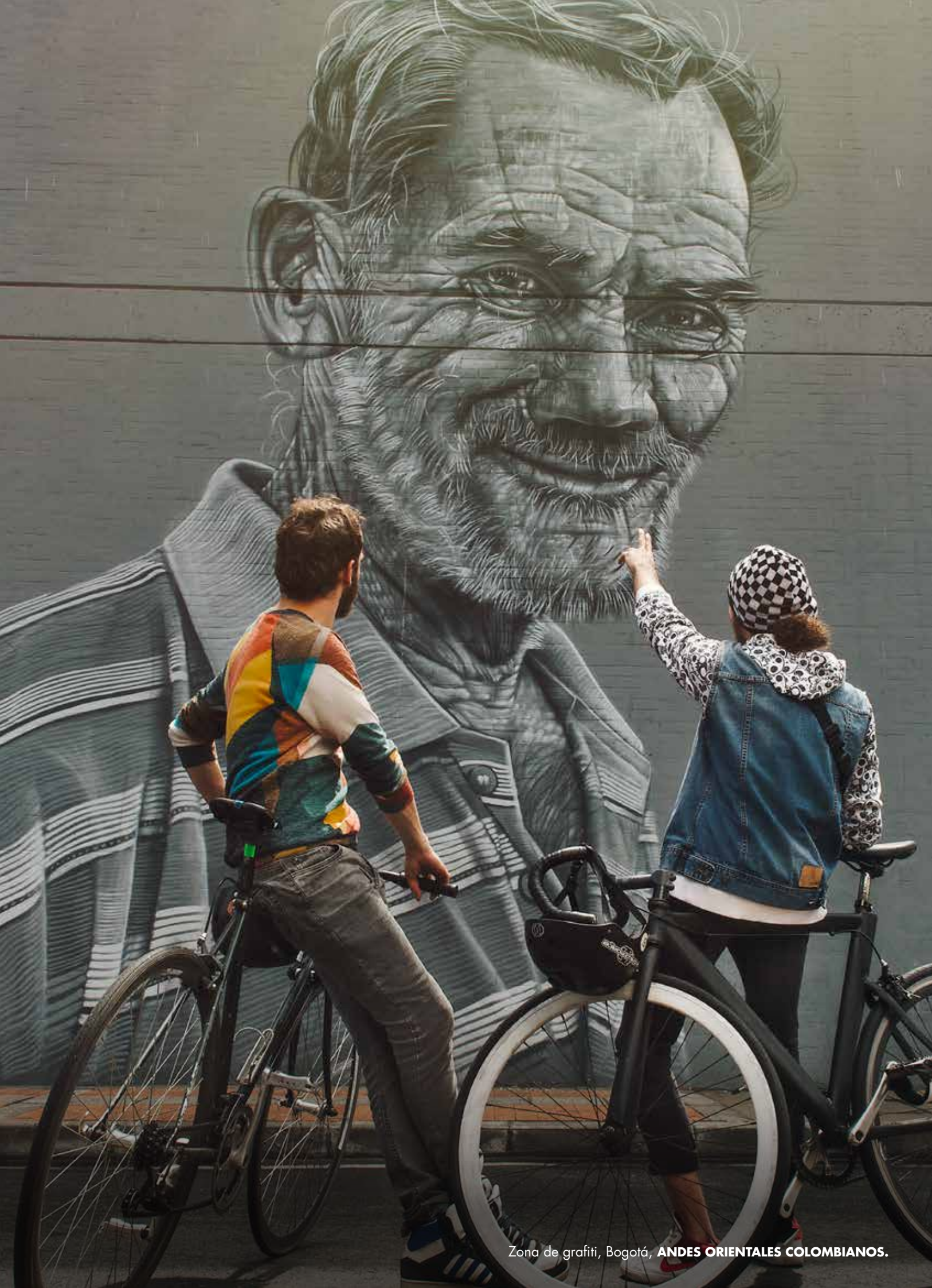
Zona de grafitti, Bogotá, ANDES ORIENTALES COLOMBIANOS.