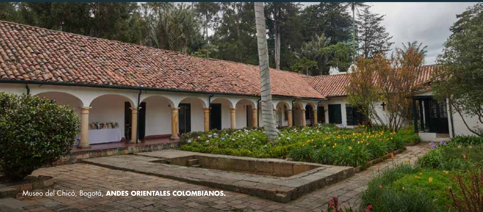
Museo del Chicó, Bogotá, ANDES ORIENTALES COLOMBIANOS.