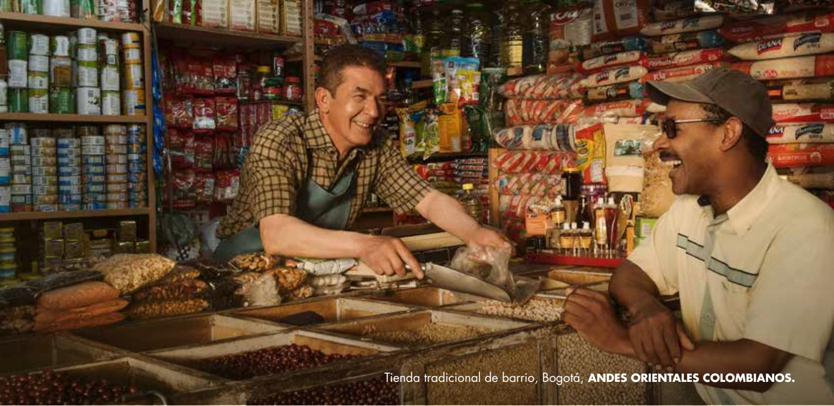
Tienda tradicional de barrio, Bogotá, ANDES ORIENTALES COLOMBIANOS.