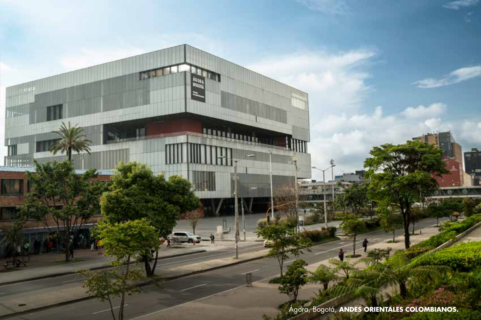
Ágora, Bogotá, ANDES ORIENTALES COLOMBIANOS.