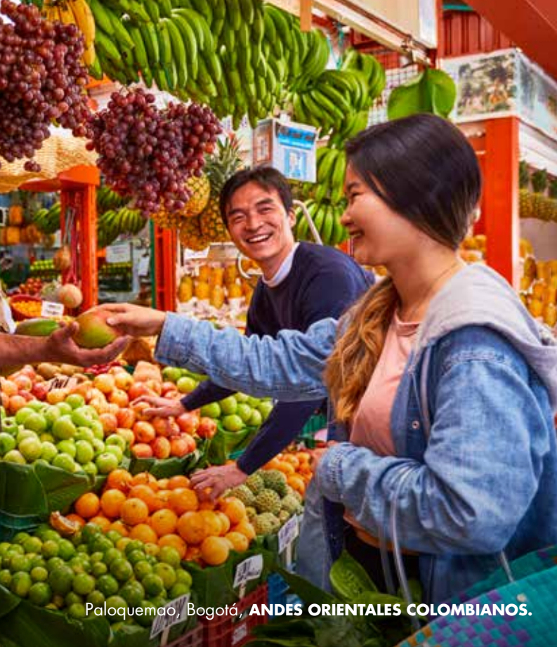
Paloquemao, Bogotá, ANDES ORIENTALES COLOMBIANOS.

En Bogotá se ha consolidado varias zonas como la Zona G, Zona T y Usaquén en el norte de la ciudad, que se han convertido en referentes gastronómicos de comida fusión, bares y cadenas de restaurantes reconocidos internacionalmente que invitan a las personas a degustar cada una de sus preparaciones.