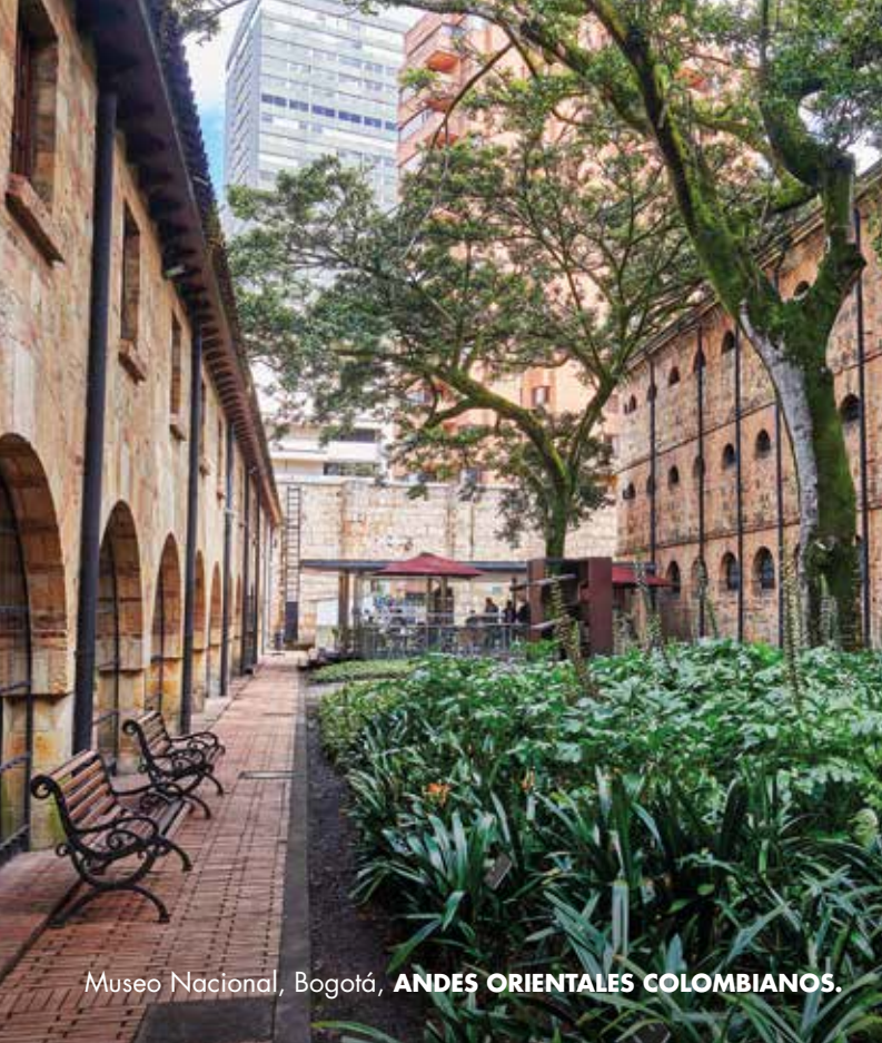
Museo Nacional, Bogotá, ANDES ORIENTALES COLOMBIANOS.