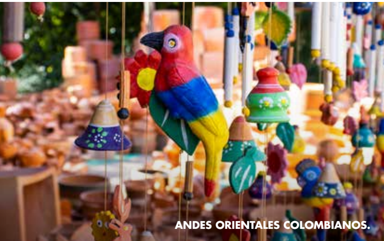
ANDES ORIENTALES COLOMBIANOS.