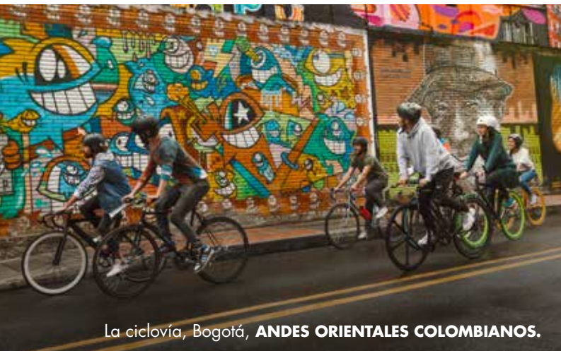
La ciclo vía, Bogotá, ANDES ORIENTALES COLOMBIANOS.

Bogotá es la ciudad donde confluyen un sinnúmero de identidades y recibe personas de todos los lugares de Colombia. En esa medida, tener la oportunidad de encontrar expresiones culturales provenientes de todo el país, permite vivir Colombia en la ciudad.