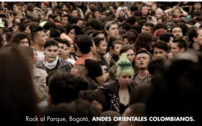
Rock al Parque, Bogotá, ANDES ORIENTALES COLOMBIANOS.

Bogotá es la ciudad de los festivales, las ferias, los conciertos. Estos constituyen lugares de encuentro de diferentes expresiones culturales, regiones y tradiciones, son entonces, así es como Bogotá celebra la diversidad que acoge, democratizando el acceso al arte, el entretenimiento y la cultura. Iconografía clave: ferias, festivales, conciertos en los que se evidencie concretamente la oportunidad de vivir la diversidad cultural.