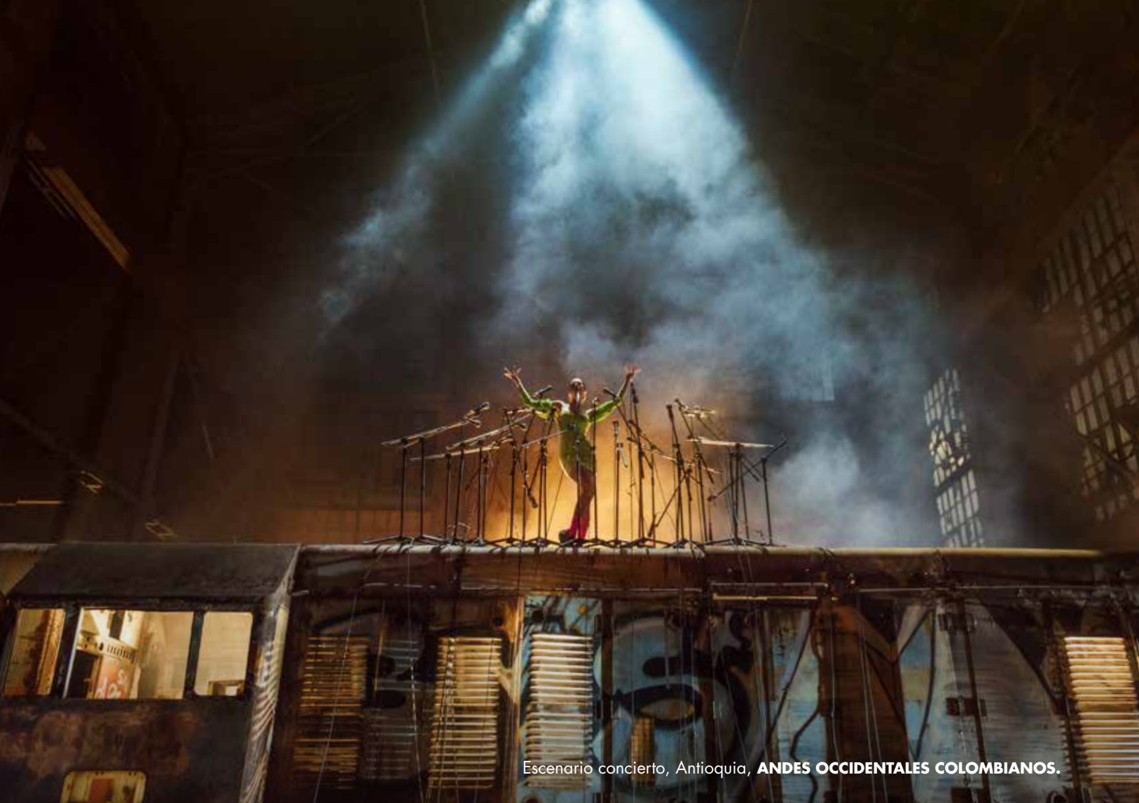
Escenario concierto, Antioquia, ANDES OCCIDENTALES COLOMBIANOS.