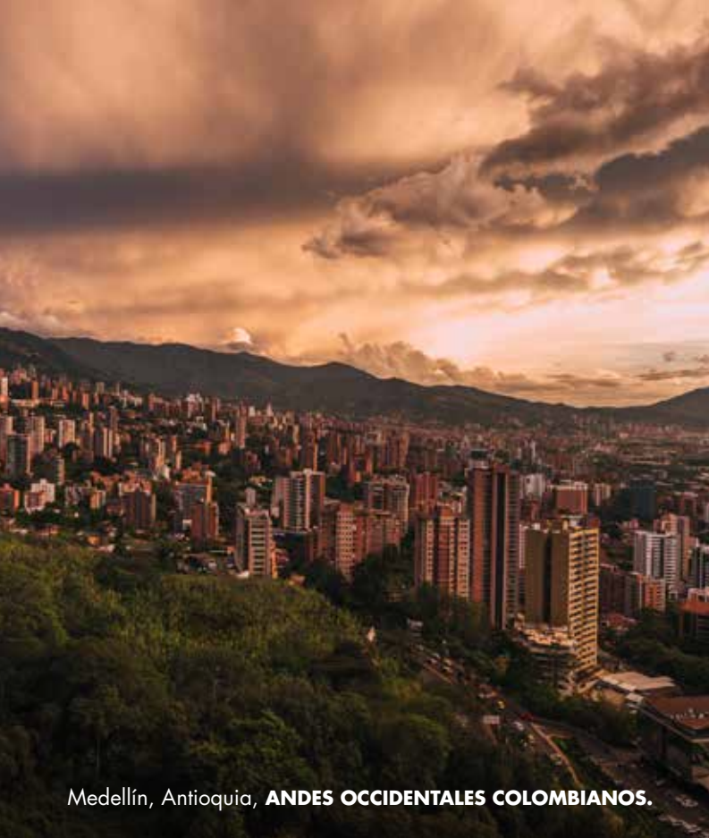
Medellín, Antioquia, ANDES OCCIDENTALES COLOMBIANOS.