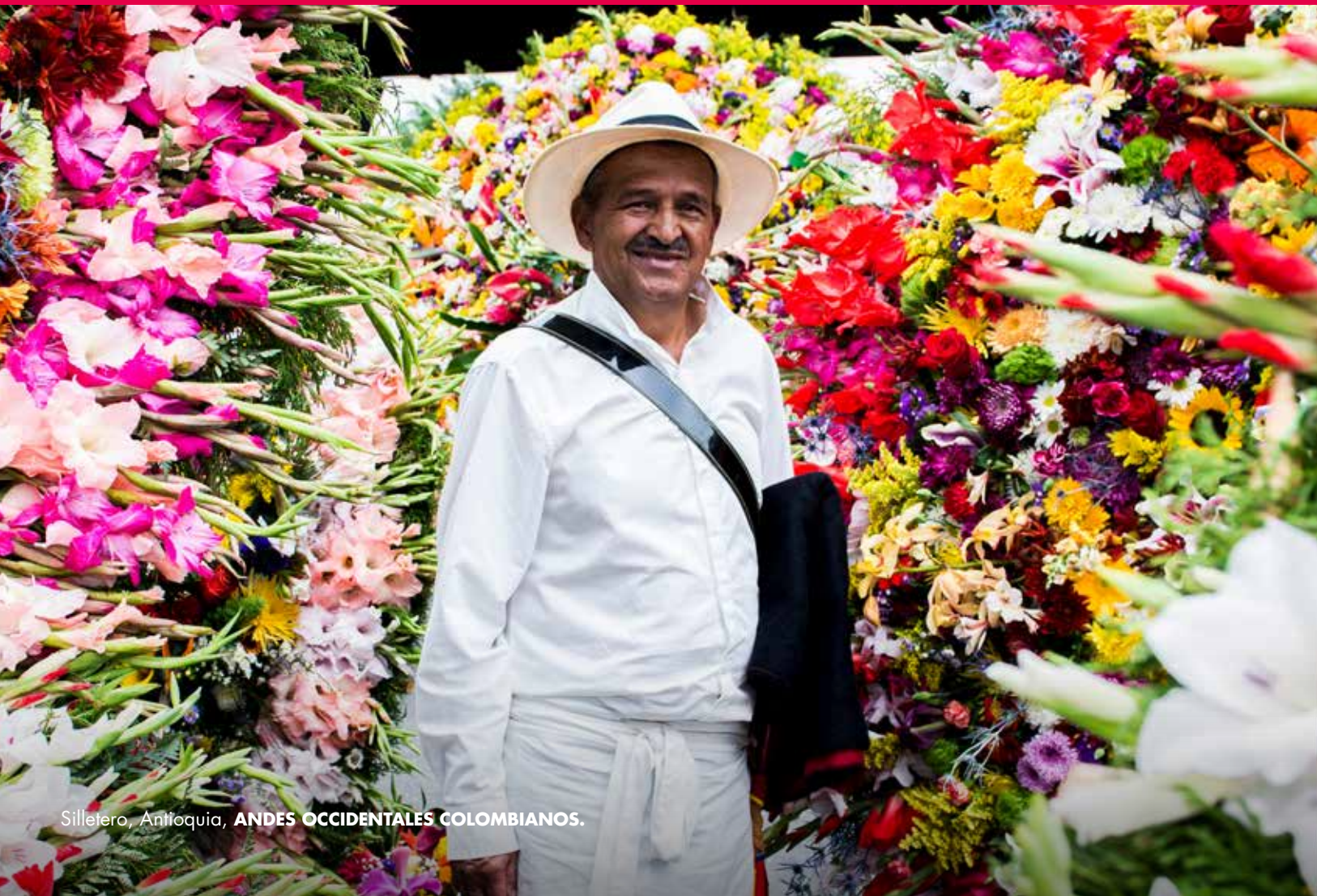
Silletero, Antioquia, ANDES OCCIDENTALES COLOMBIANOS.