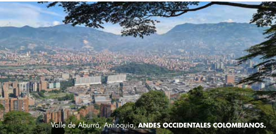
Valle de Aburrá, Antioquia, ANDES OCCIDENTALES COLOMBIANOS.

Históricamente golpeada por la violencia, Antioquia es una región que se defiende de la estigmatización que el pasado le ha dejado. Para alejarse del estigma reconoce su pasado y le da mayor importancia a su capacidad para transformarse.