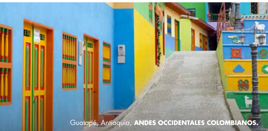
Guatapé, Antioquia, ANDES OCCIDENTALES COLOMBIANOS.

Subir implica recorrer un camino para llegar a la cima: el lugar donde se superan obstáculos y se crean estrategias para seguir. De esta manera, llegar a lo alto y volver la mirada sobre el camino genera orgullo y satisfacción.