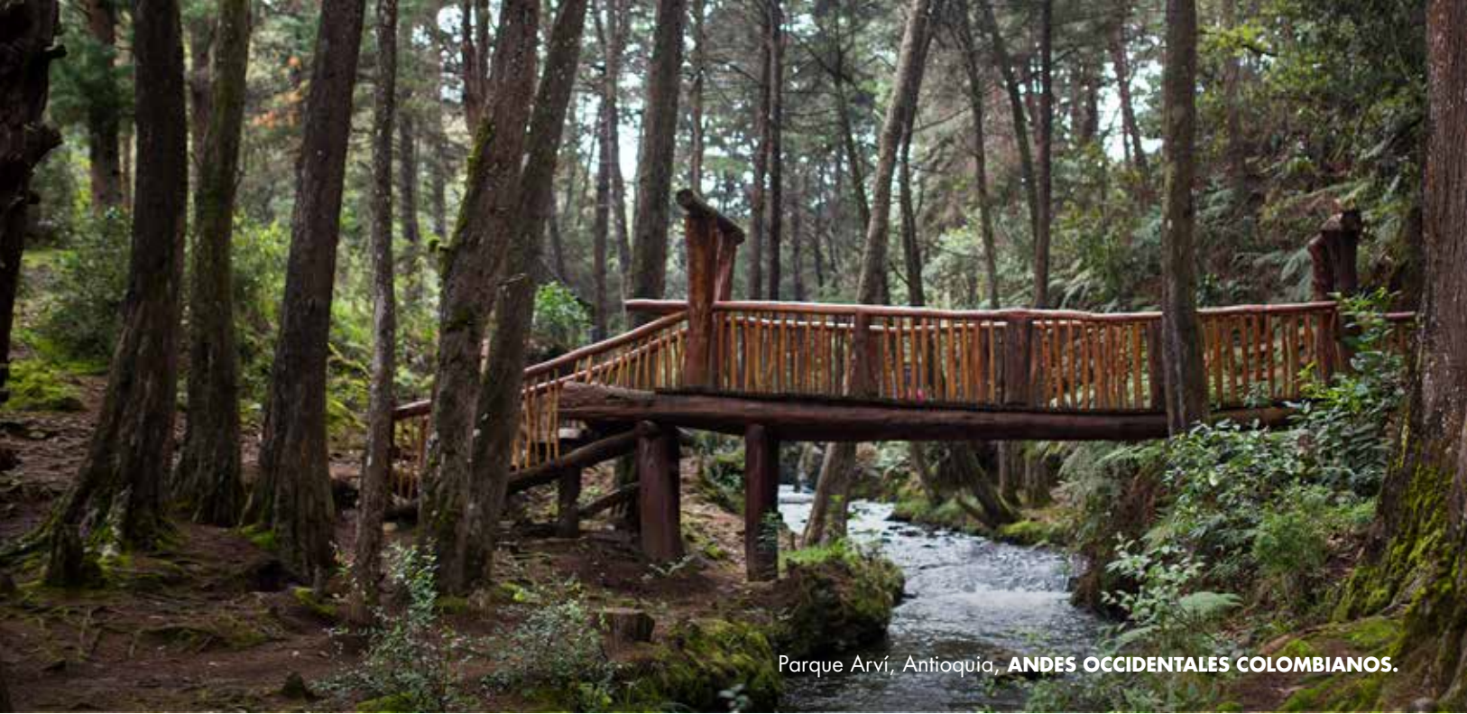
Parque Arví, Antioquia, ANDES OCCIDENTALES COLOMBIANOS.