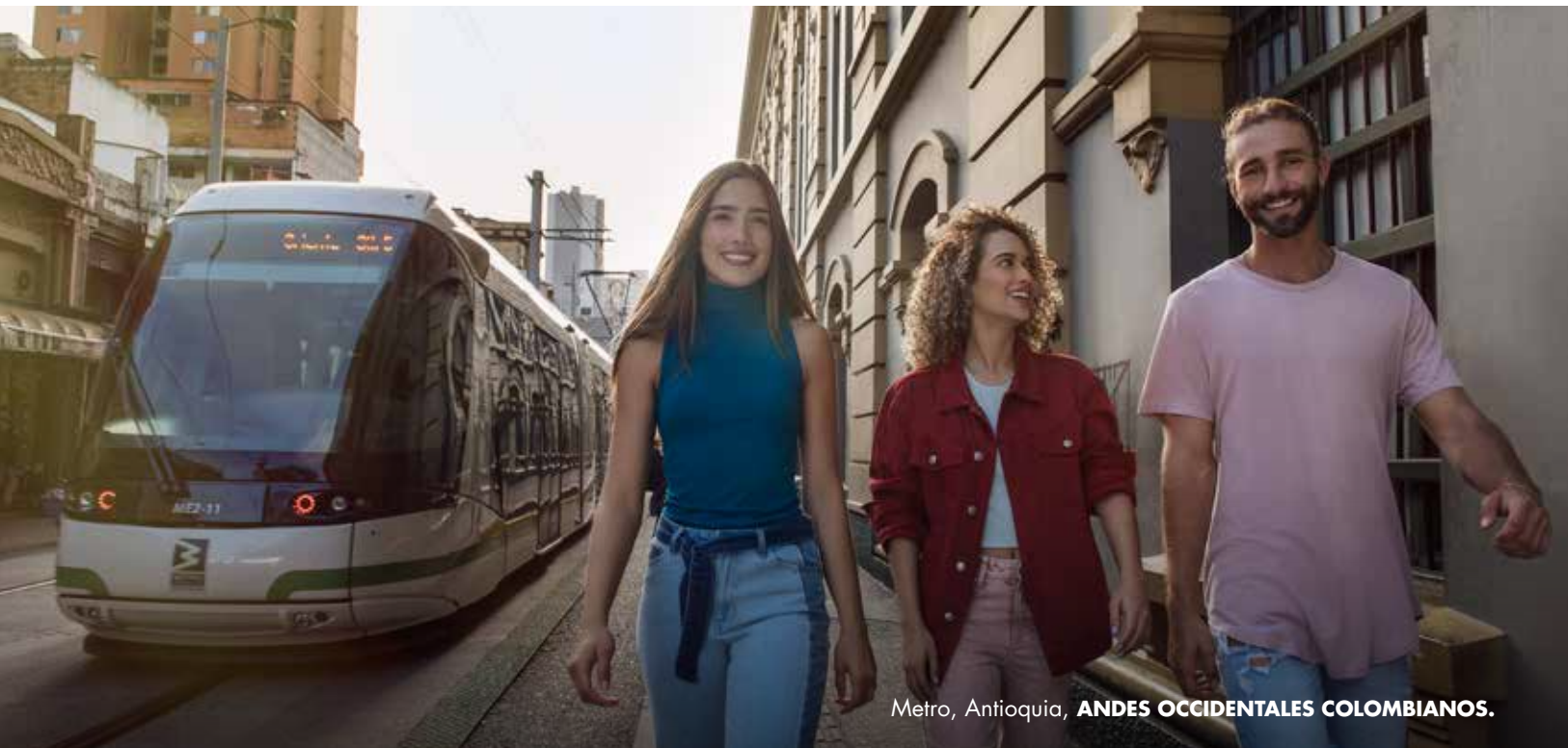
Metro, Antioquia, ANDES OCCIDENTALES COLOMBIANOS.

Reflejan la pujanza, la fuerza, el empuje y la templanza de los pobladores por la creación de oportunidades ante las adversidades. Asimismo, la cultura silleterera simboliza la fuerza del campesino floricultor quien, desde su labor, cultiva y saca adelante la producción de flores para participar y ser motivo de admiración y orgullo.