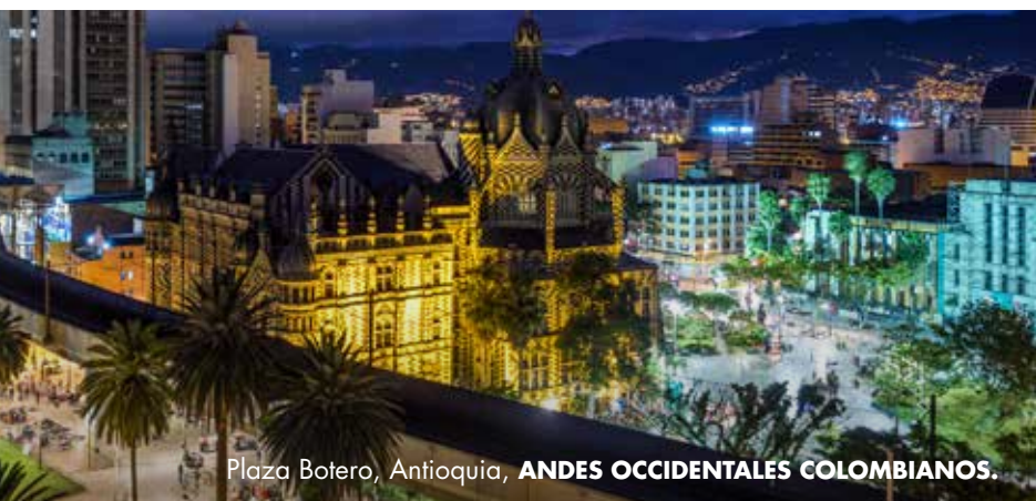
Plaza Botero, Antioquia, ANDES OCCIDENTALES COLOMBIANOS.

En tanto el camino que se recorre (específicamente en Antioquia) es empinado, llegar a la cima es una labor que requiere de un gran esfuerzo.