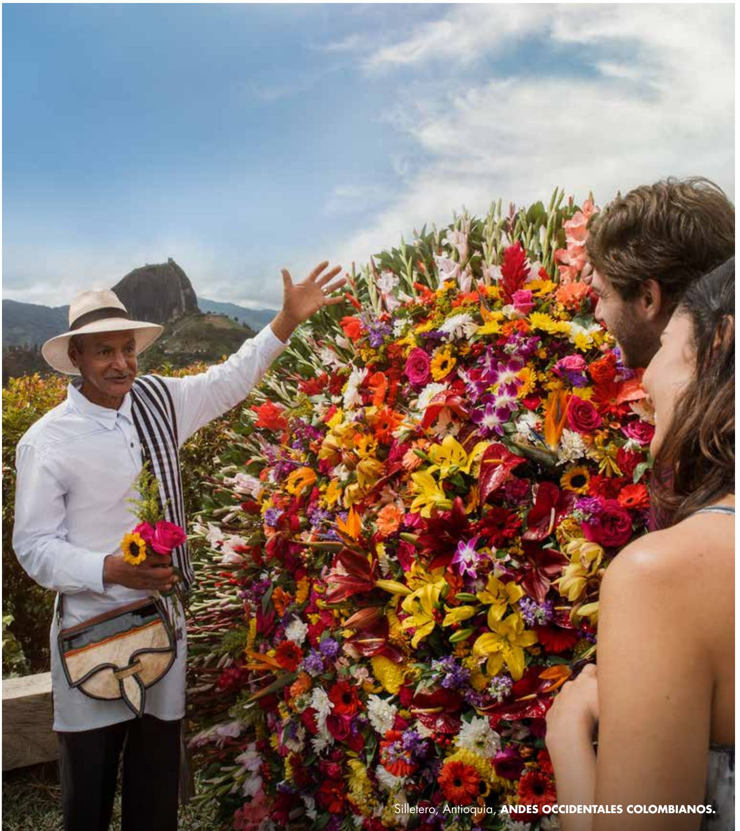
Silletero, Antioquia, ANDES OCCIDENTALES COLOMBIANOS.

En cuanto a su gastronomía, la oferta es tan variada como los cultivos de la montaña que representan la abundancia. Entre sus platos típicos cabe destacar la famosa bandeja paisa, el fiambre, los frijoles con pezuña, la mazamorra paisa y las arepas con quesito, que no pueden faltar en la mesa de todas las familias paisas. No en vano, en Antioquia acostumbra a comer siete veces al día.