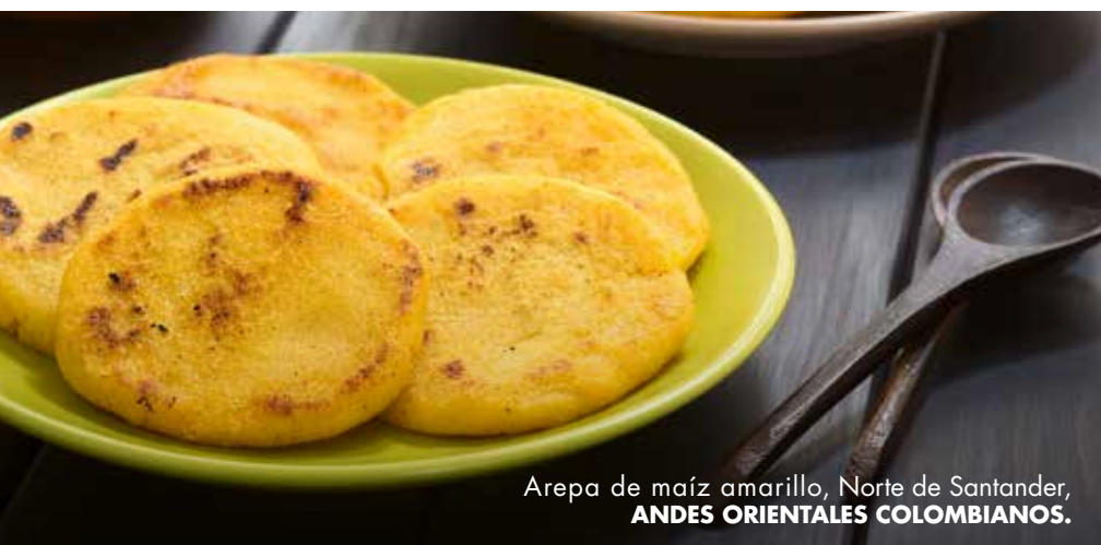
Arepa de maíz amarillo, Norte de Santander, ANDES ORIENTALES COLOMBIANOS.

Los rasgos característicos del acento, una voz fuerte y el manoteo al hablar son parte del ADN de los habitantes de la región.