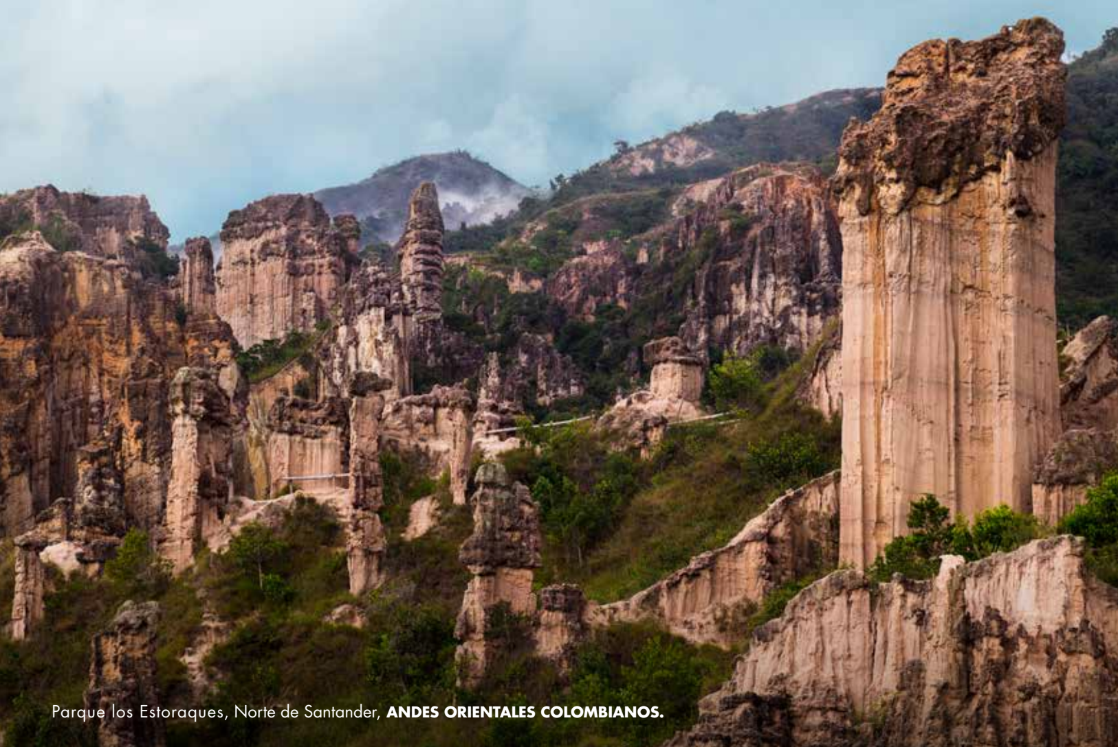
Parque los Estoraques, Norte de Santander, ANDES ORIENTALES COLOMBIANOS .