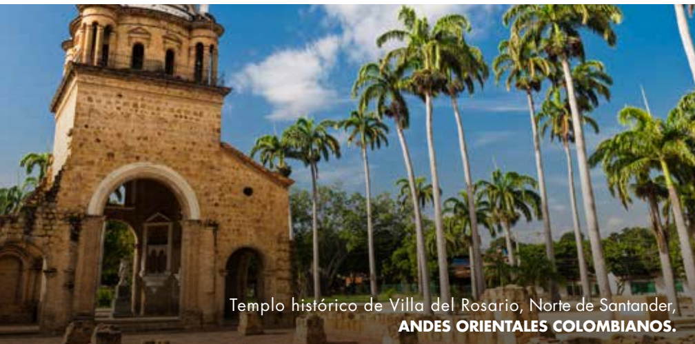
Templo histórico de Villa del Rosario, Norte de Santander, ANDES ORIENTALES COLOMBIANOS.