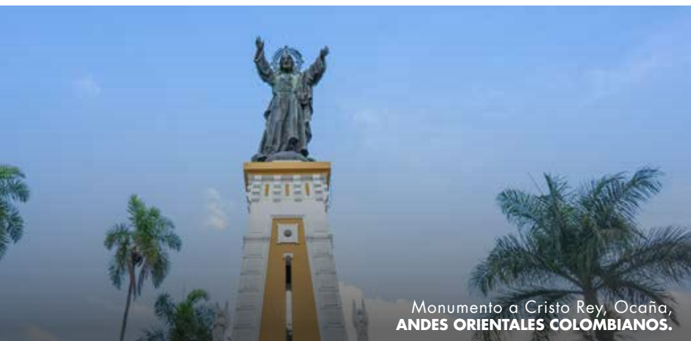
Monumento a Cristo Rey, Ocaña, ANDES ORIENTALES COLOMBIANOS.

Es una tierra de importancia histórica, donde sucedieron acontecimientos que consolidaron la nación.