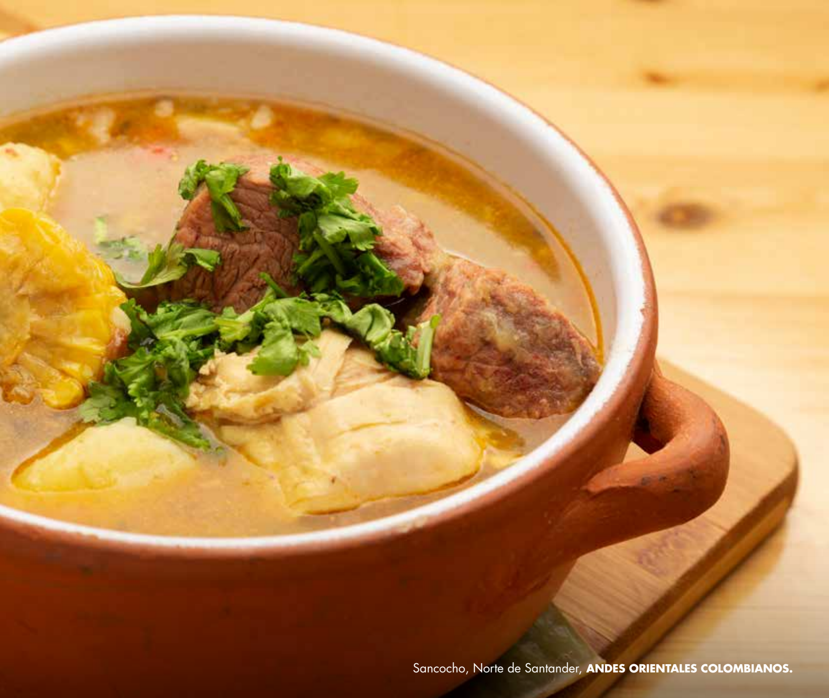
Sancocho, Norte de Santander, ANDES ORIENTALES COLOMBIANOS.

El nortesantanderano es el resultado de ese relieve agresivo que enmarca su región y que se ancla al legado indígena de sus antepasados, resaltando la rudeza, franqueza y templanza en sus interacciones, a través de su acento, un tono de voz fuerte, sus expresiones y el hablar con las manos permiten ver su relación con su entorno.