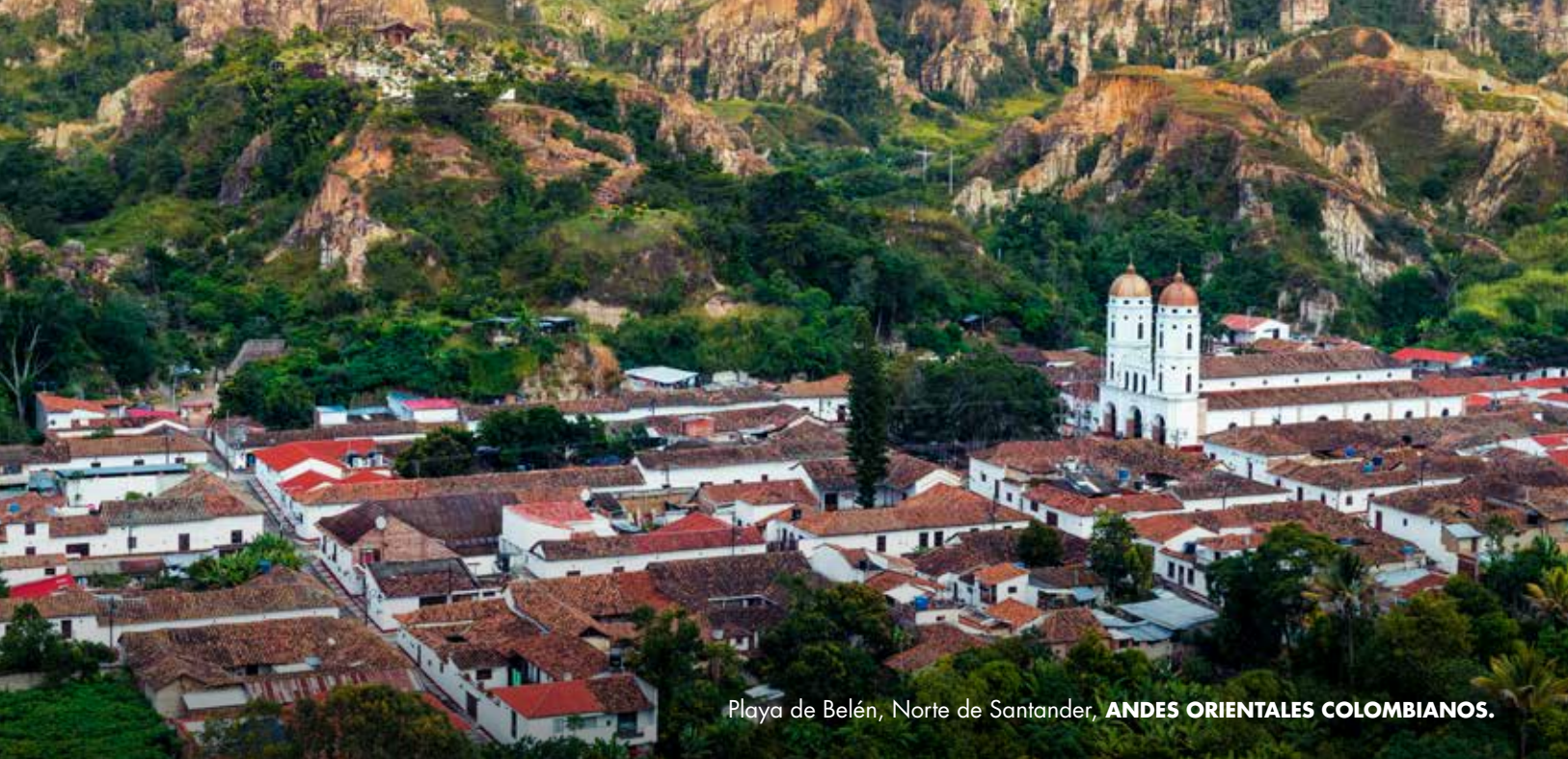
Playa de Belén, Norte de Santander, ANDES ORIENTALES COLOMBIANOS.