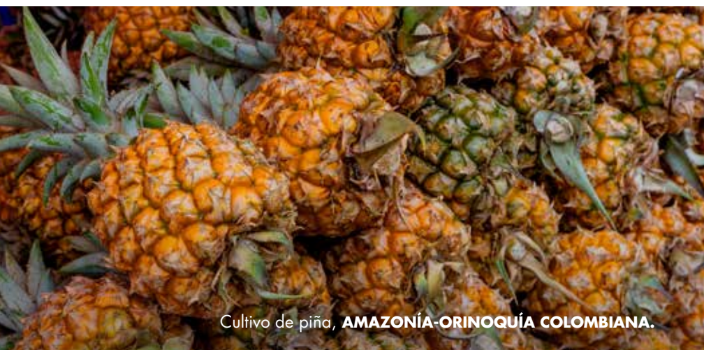
Cultivo de piña, AMAZONÍA-ORINOQUÍA COLOMBIANA.

El arte rupestre, las representaciones y los dibujos son el reflejo de una cultura que conserva y guarda saberes y rituales de comunidades que habitaron su territorio en el pasado.