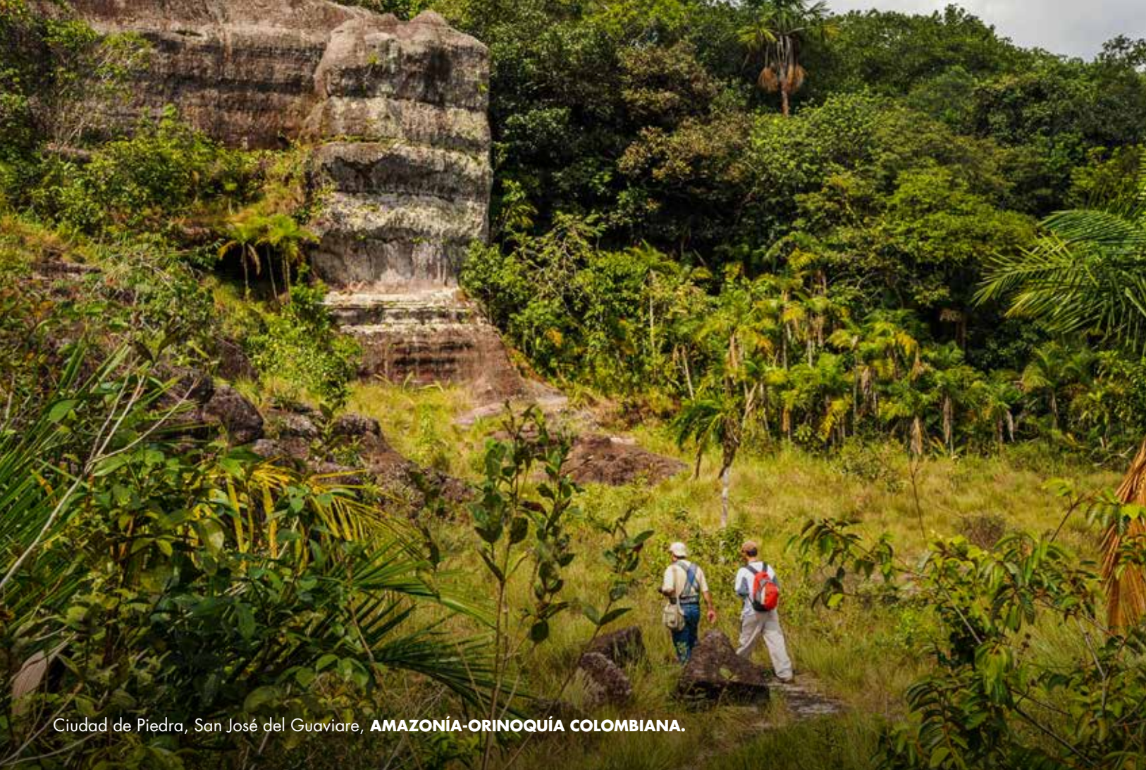
Ciudad de Piedra, San José del Guaviare, AMAZONÍA-ORINOQUÍA COLOMBIANA.