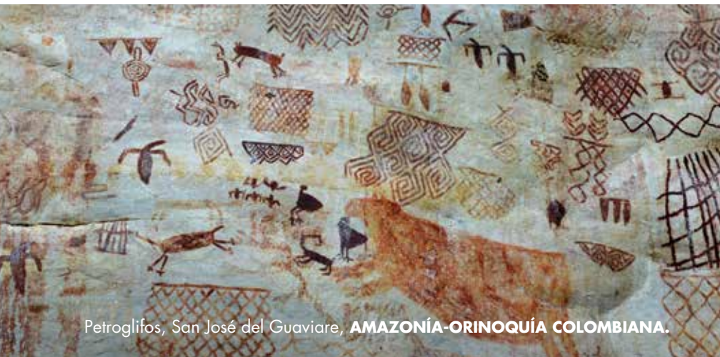
Petroglifos, San José del Guaviare, AMAZONÍA-ORINOQUÍA COLOMBIANA.

Pertenecen a una de las zonas geográficas más antiguas de la tierra y que ha sido poco explorada, lo que la hace poseer un sinnúmero de especies de flora y fauna.