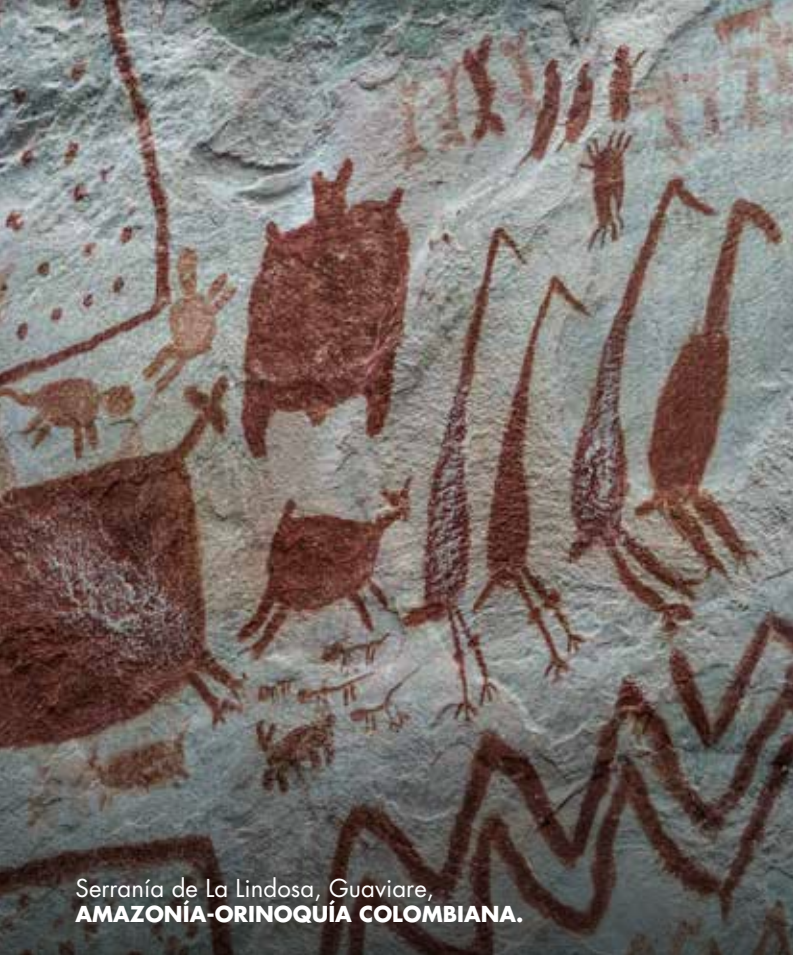
Serranía de La Lindosa, Guaviare, AMAZONÍA-ORINOQUÍA COLOMBIANA.