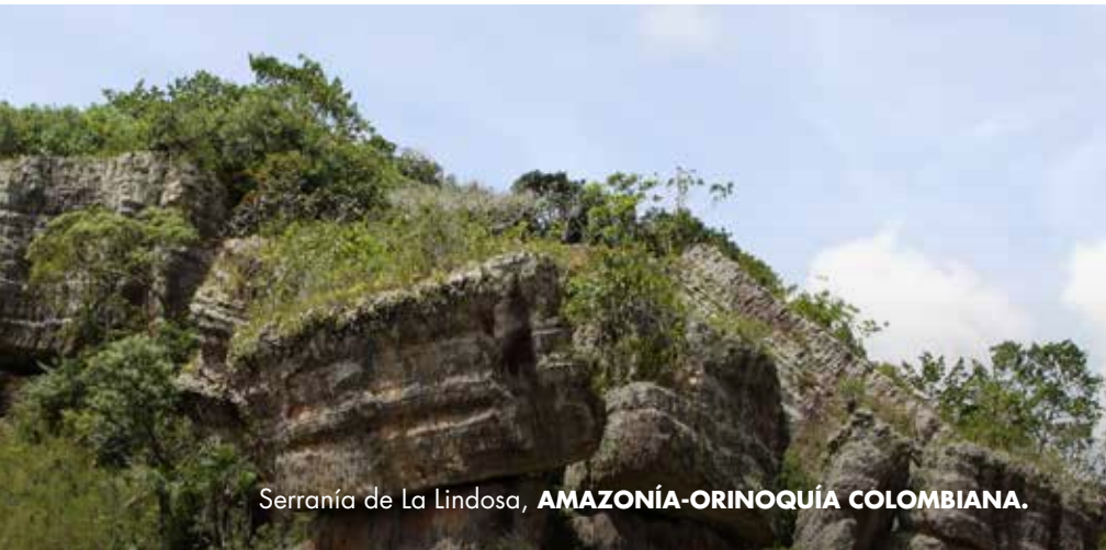
Serranía de La Lindosa, AMAZONÍA-ORINOQUÍA COLOMBIANA.