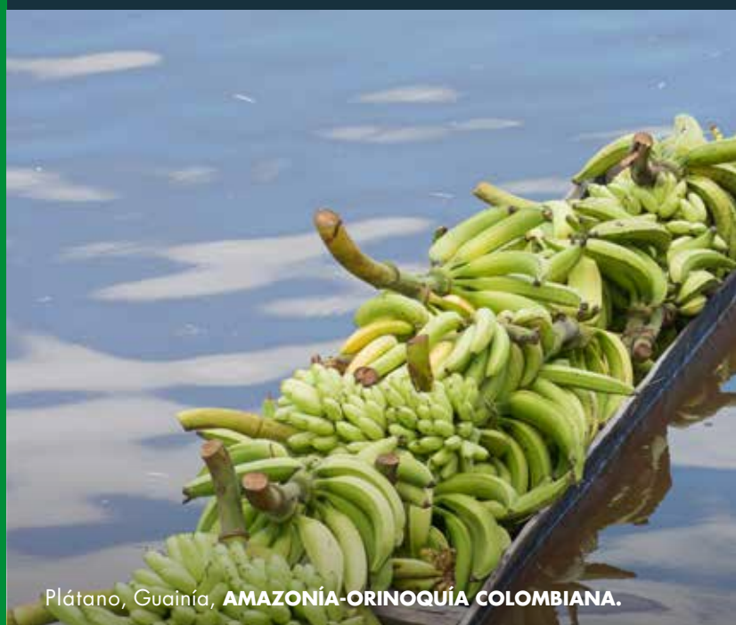
Plátano, Guainía, AMAZONÍA-ORINOQUÍA COLOMBIANA.