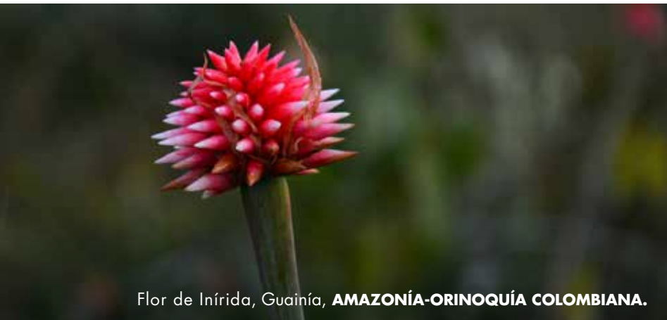
Flor de Inírida, Guainía, AMAZONÍA-ORINOQUÍA COLOMBIANA.

Los ríos representan un gran atractivo turístico para el departamento, ya que está rodeado de ellos y es el medio de transporte y alimentación de muchos en el territorio.