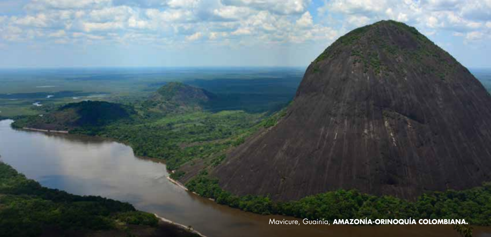
Mavicure, Guainía, AMAZONÍA-ORINOQUÍA COLOMBIANA.