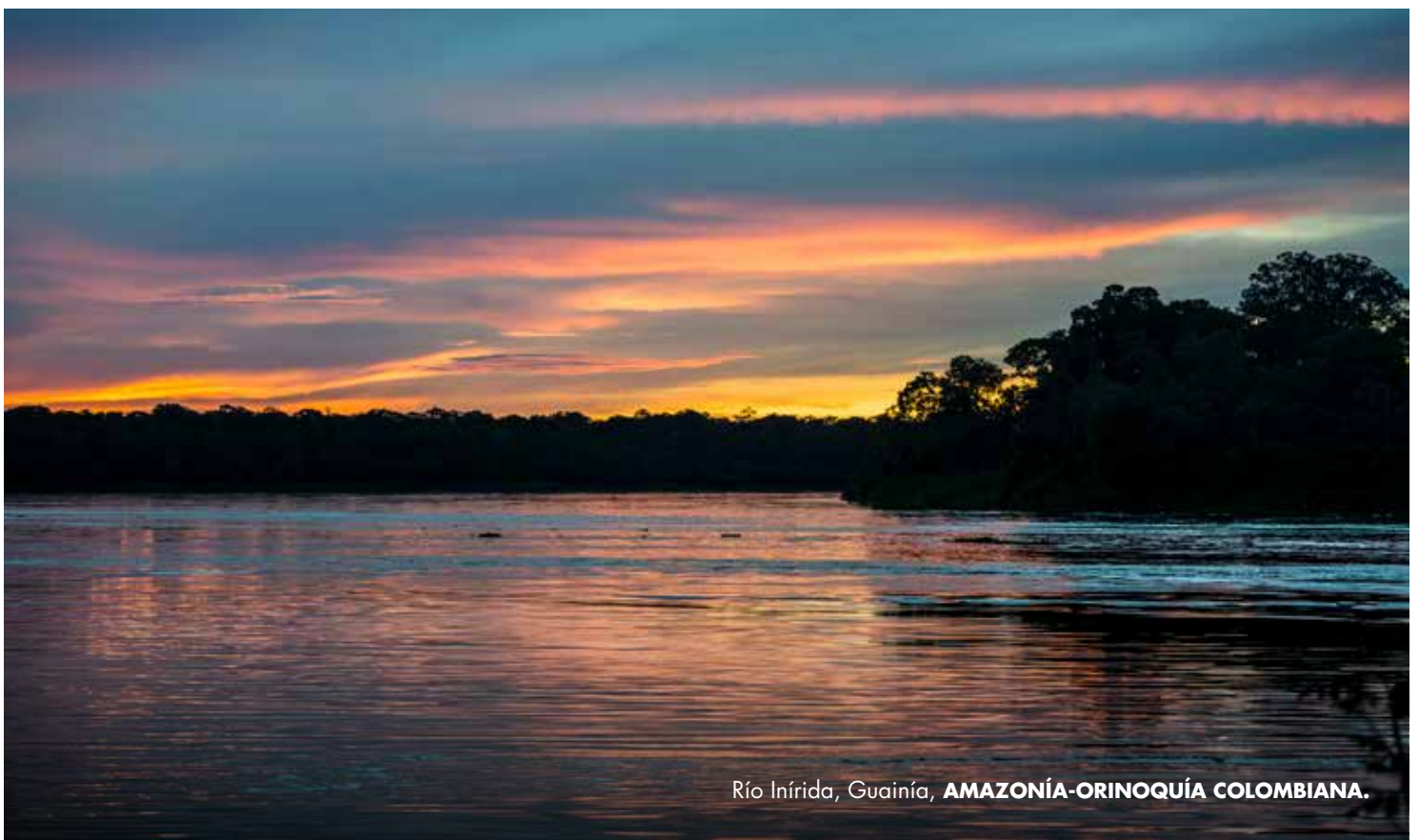
Río Inírida, Guainía, AMAZONÍA-ORINOQUÍA COLOMBIANA.