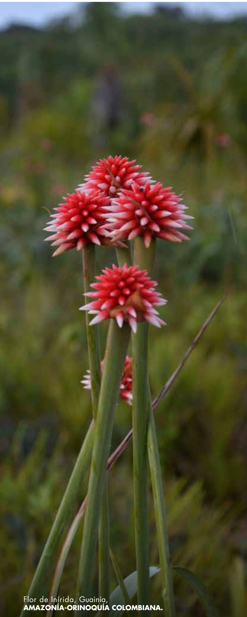
Flor de Inírida, Guainía, AMAZONÍA-ORINOQUÍA COLOMBIANA.

de ganado, introducido por los misioneros jesuitas. Como en otras comunidades, los hombres son tejedores y fabrican las hamacas de fibras de cumare y moriche, canastos, esterillas, flautas y sebucanes.