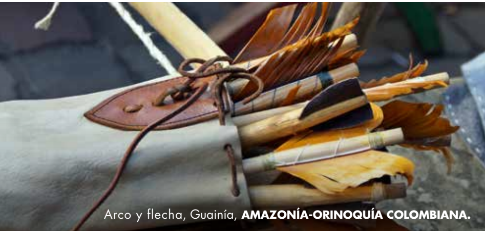
Arco y flecha, Guainía, AMAZONÍA-ORINOQUÍA COLOMBIANA.