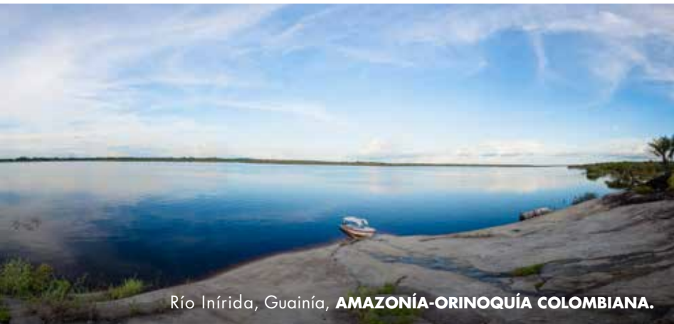
Río Inírida, Guainía, AMAZONÍA-ORINOQUÍA COLOMBIANA.

Son la representación de las formas en las que adquieren sus alimentos y la demostración de la permanencia de una práctica que viene desde sus ancestros.