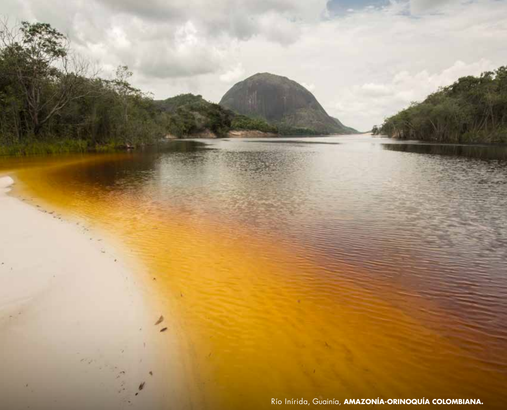
Río Inírida, Guainía, AMAZONÍA-ORINOQUÍA COLOMBIANA.