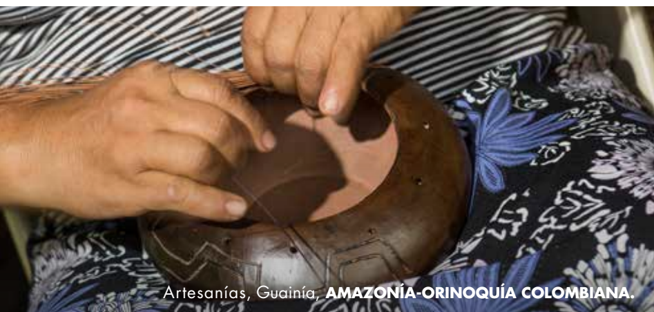
Artesanías, Guainía, AMAZONÍA-ORINOQUÍA COLOMBIANA.

Es una representante del territorio, ya que es una especie que solo se da en esta zona.