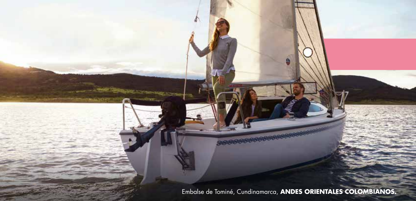
Embalse de Tominé, Cundinamarca, ANDES ORIENTALES COLOMBIANOS.