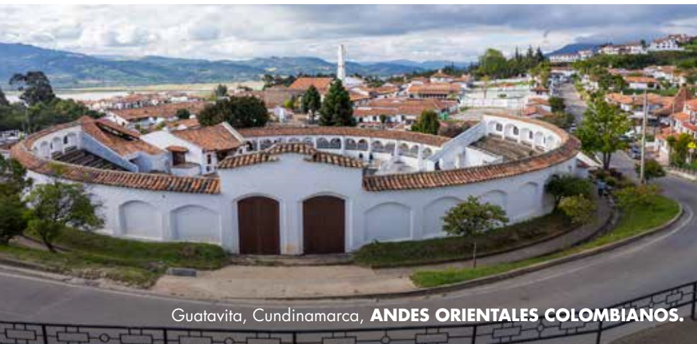
Guatavita, Cundinamarca, ANDES ORIENTALES COLOMBIANOS.

Es una región de paisajes hídricos con páramos, lagunas, cascadas, ríos y embalses.