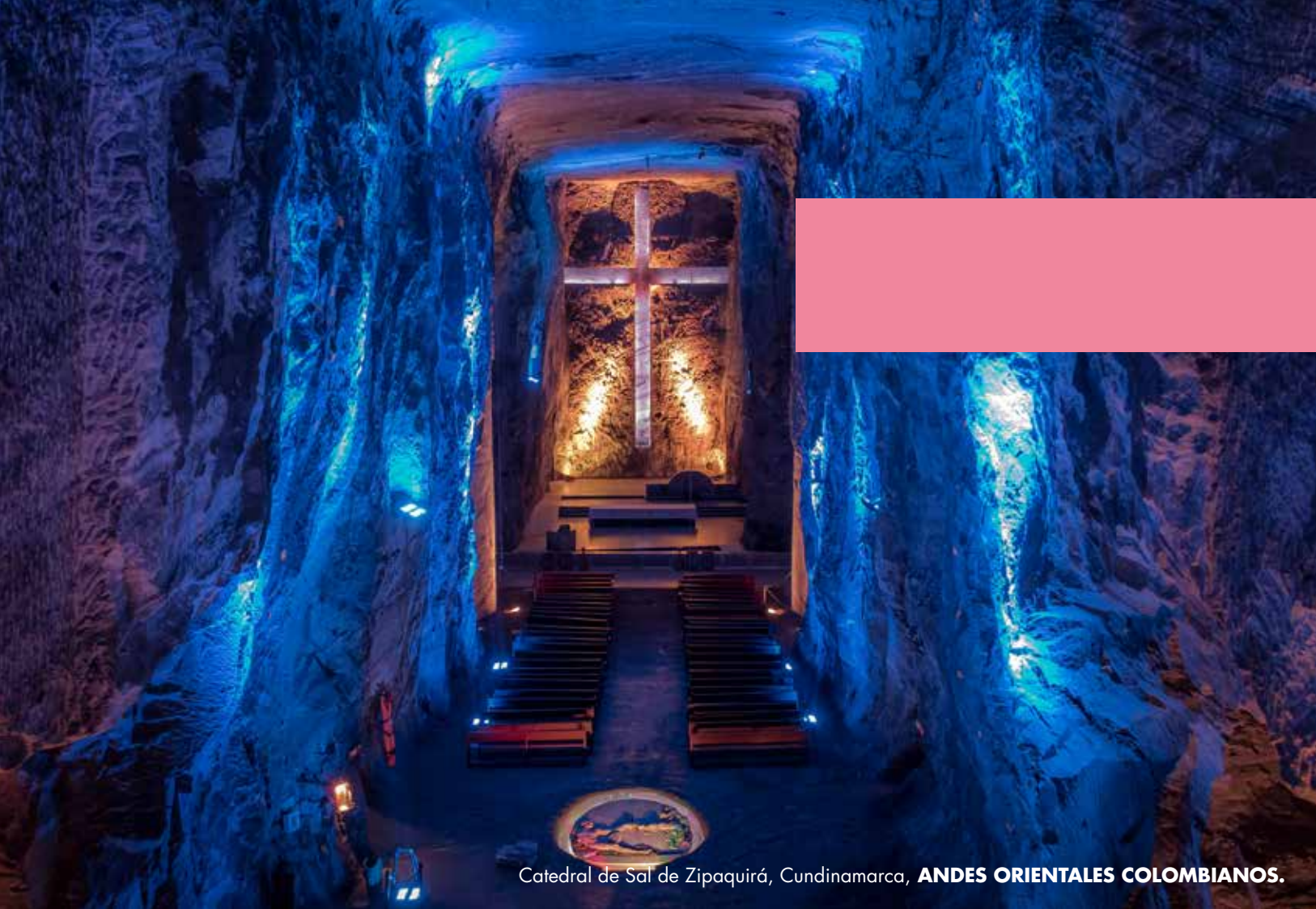
Catedral de Sal de Zipaquirá, Cundinamarca, ANDES ORIENTALES COLOMBIANOS.