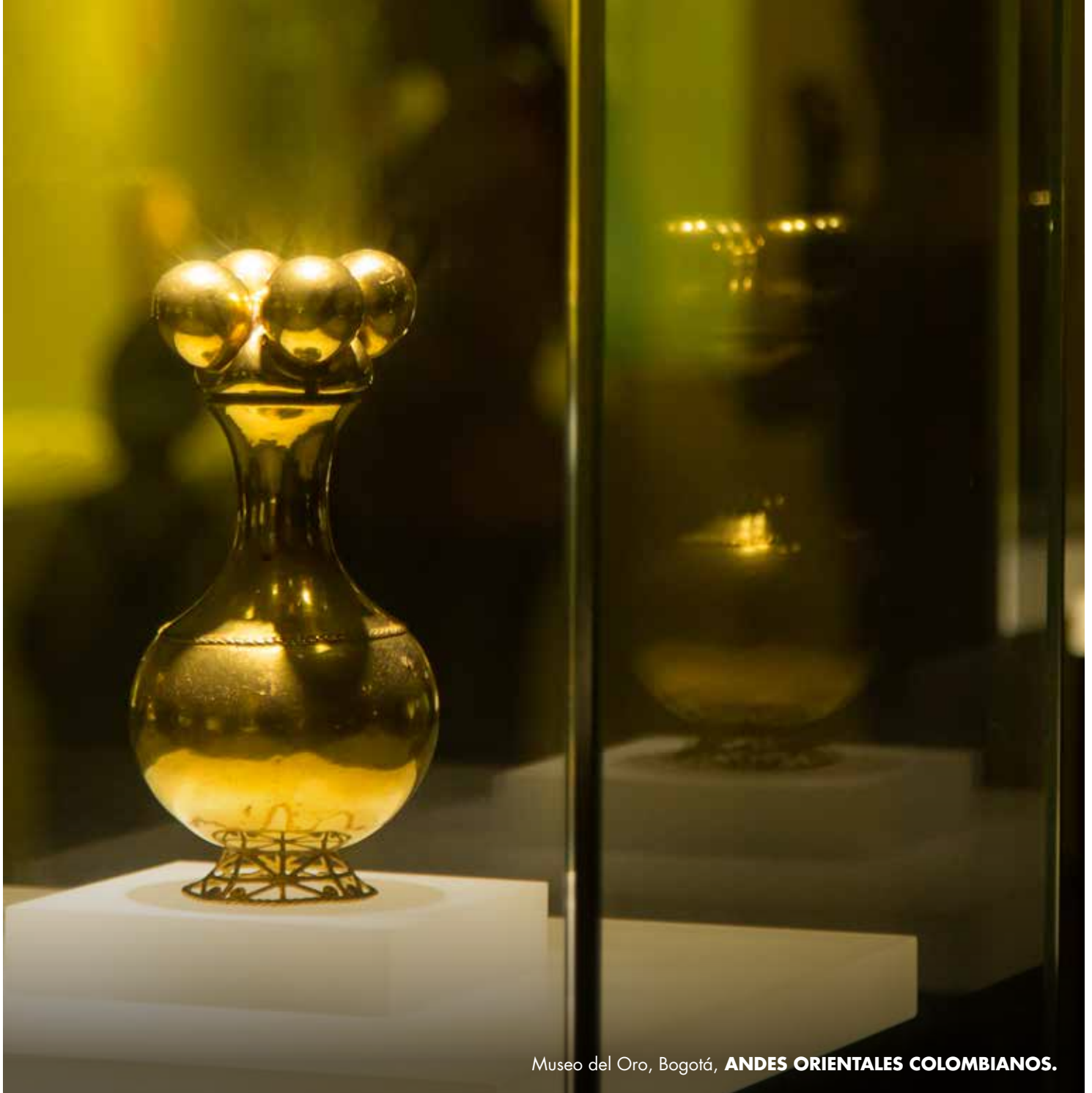
Museo del Oro, Bogotá, ANDES ORIENTALES COLOMBIANOS.

En este sentido, varios de los atractivos turísticos de Cundinamarca tienen que ver con este legado indígena, cuyas leyendas sobreviven en los lugares que eran sagrados para los muiscas como, por ejemplo, el Salto del Tequendama, que fue creado por Bochica, o la laguna de Guatavita, donde se creía que existió El Dorado, la mítica ciudad de oro que tanto buscaron los españoles.