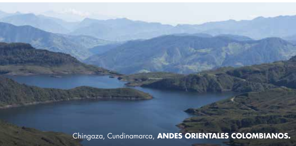
Chingaza, Cundinamarca, ANDES ORIENTALES COLOMBIANOS.

Cundinamarca cuida y protege el recurso natural que veneraron y protegieron los muisca. Invita a peregrinar por los caminos que llevan a estos lugares sagrados.