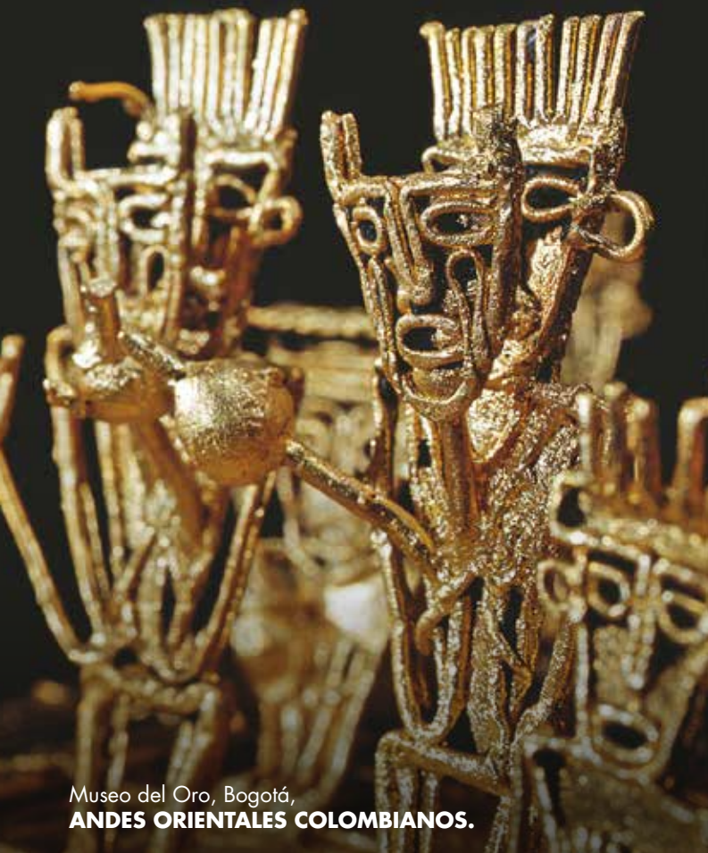
Museo del Oro, Bogotá, ANDES ORIENTALES COLOMBIANOS.