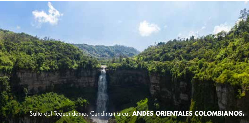
Salto del Tequendama, Cundinamarca, ANDES ORIENTALES COLOMBIANOS.