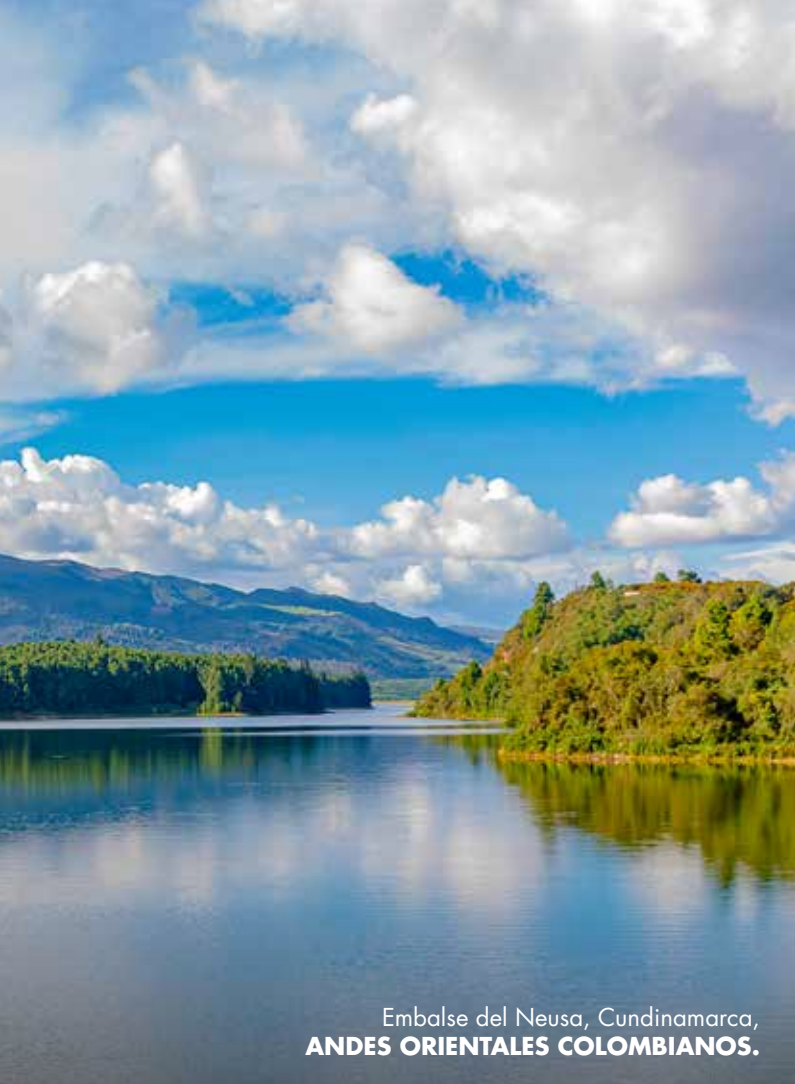
Embalse del Neusa, Cundinamarca, ANDES ORIENTALES COLOMBIANOS.

El agua fluye por los paisajes de Cundinamarca. Hay cascadas, lagos, lagunas, ríos, humedales y embalses que hacen que sea toda una experiencia disfrutar y vivir el agua. No importa en qué lugar esté el visitante, siempre va a ser el símbolo característico. La fuerza del agua se aprovecha en sus embalses para la generación de energía eléctrica, que provee a otras regiones del país. “Tenemos, por ejemplo, el Festival de la Luz en Mesitas por ser generadores de luz. En general la electricidad no la hacemos para Cundinamarca, sino para otras regiones. Abastecemos de energía a buena parte de Colombia” , afirmó un orgulloso habitante del departamento.