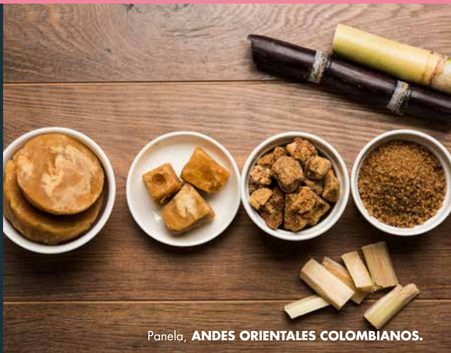
Panela, ANDES ORIENTALES COLOMBIANOS.