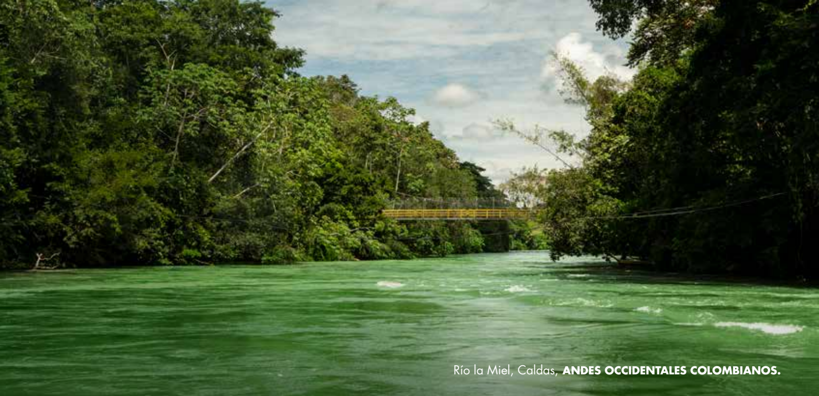
Río la Miel, Caldas, ANDES OCCIDENTALES COLOMBIANOS.