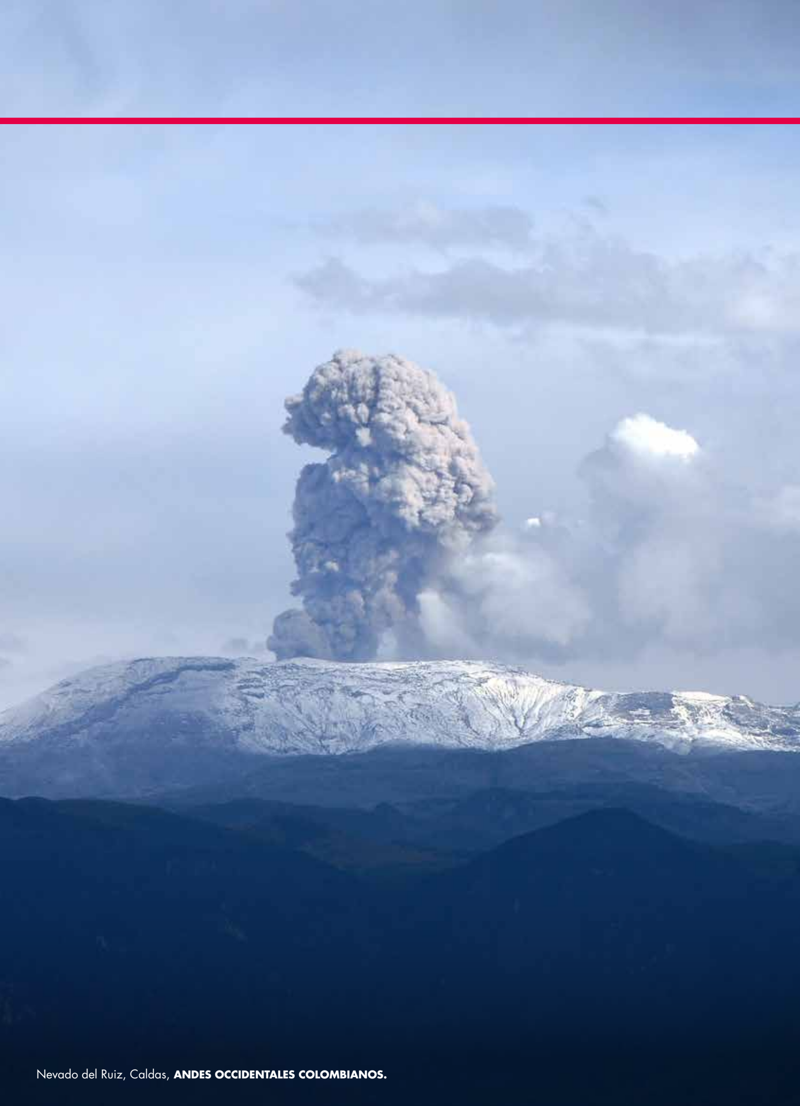
Nevado del Ruiz, Caldas, ANDES OCCIDENTALES COLOMBIANOS.