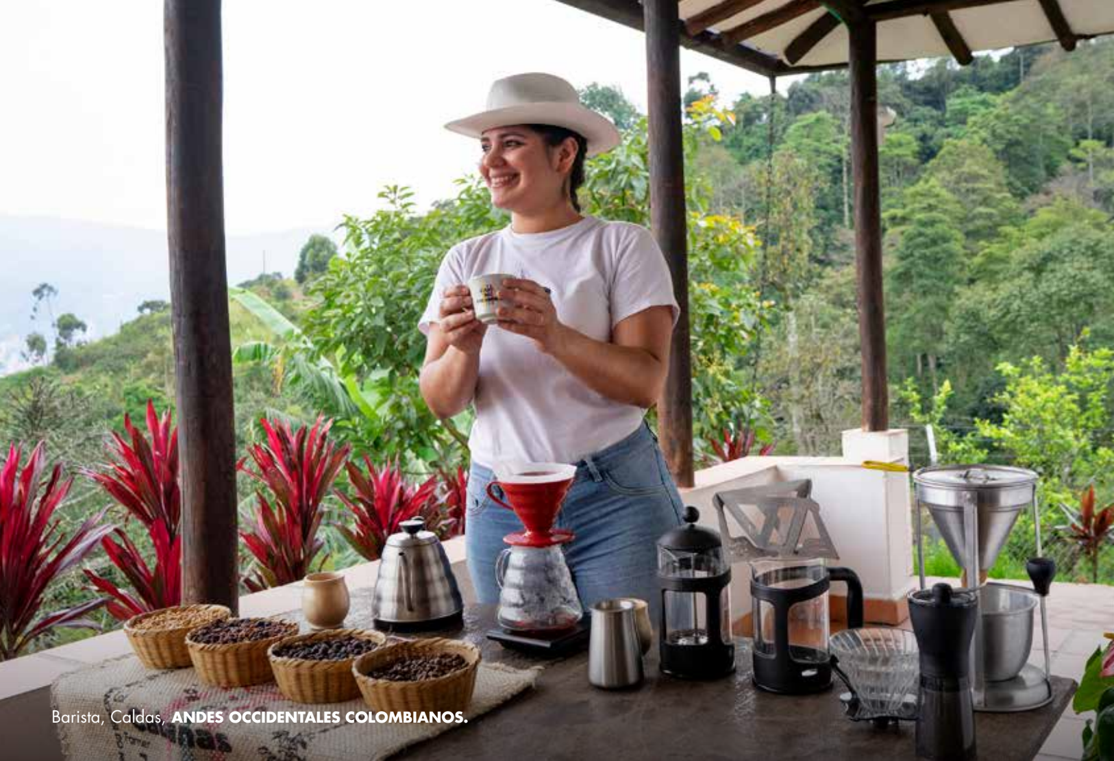
Barista, Caldas, ANDES OCCIDENTALES COLOMBIANOS.