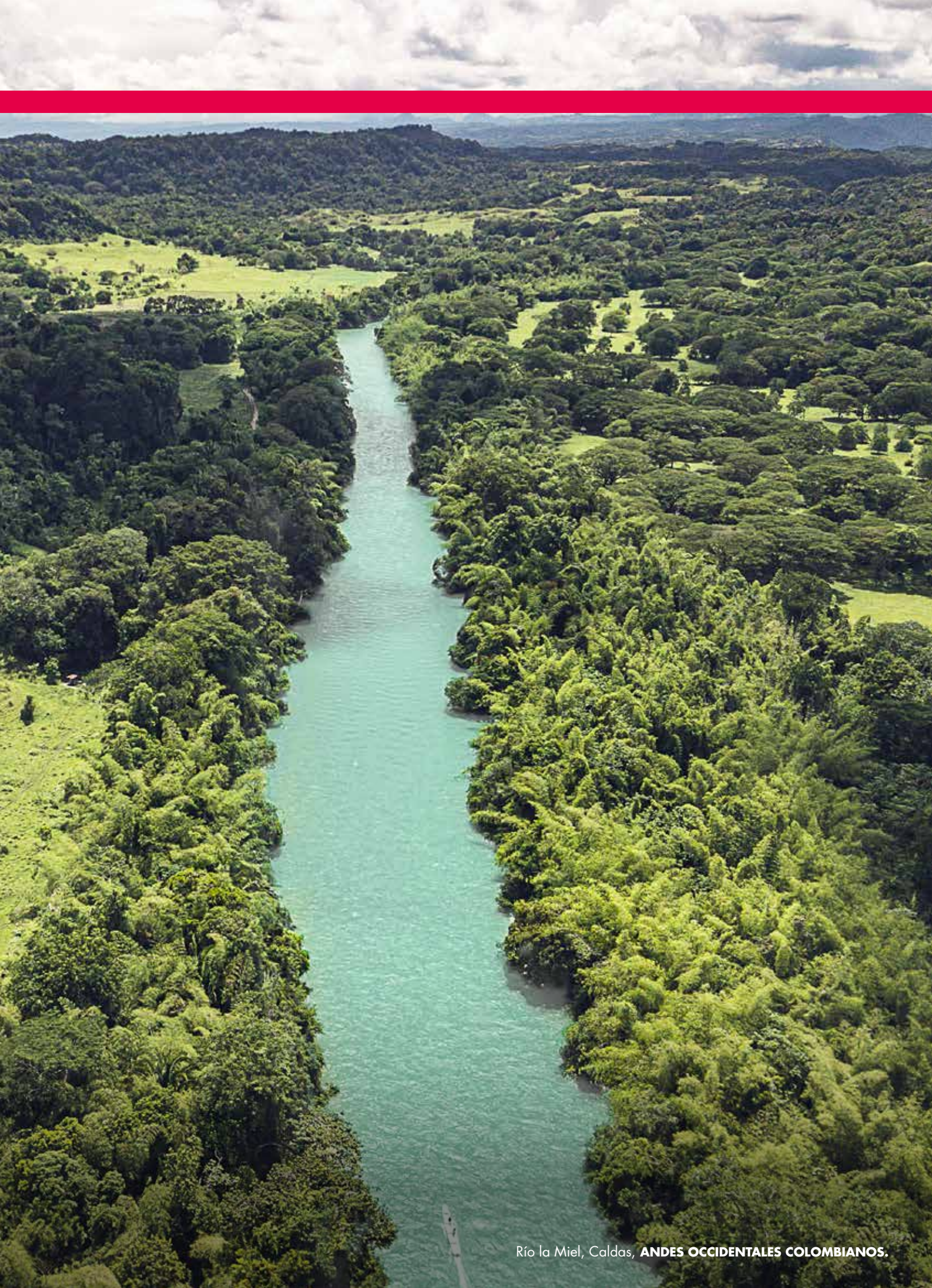
Río la Miel, Caldas, ANDES OCCIDENTALES COLOMBIANOS.