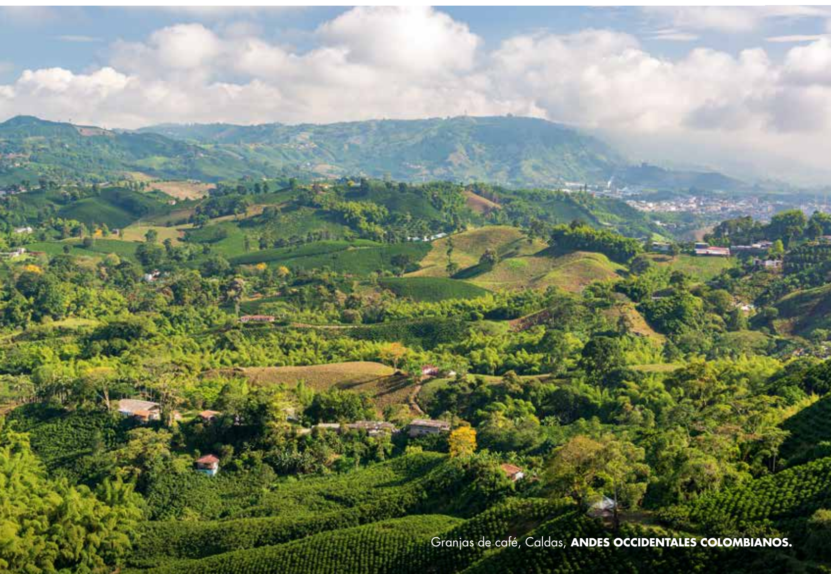
Granjas de café, Caldas, ANDES OCCIDENTALES COLOMBIANOS.