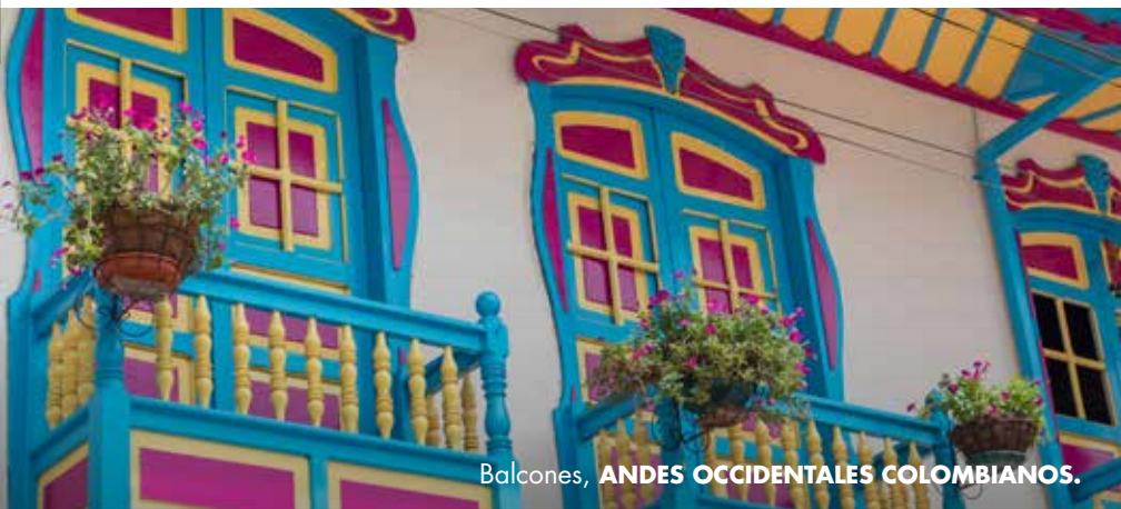
Balcones, ANDES OCCIDENTALES COLOMBIANOS.

Son lugares icónicos de la capital caldense.