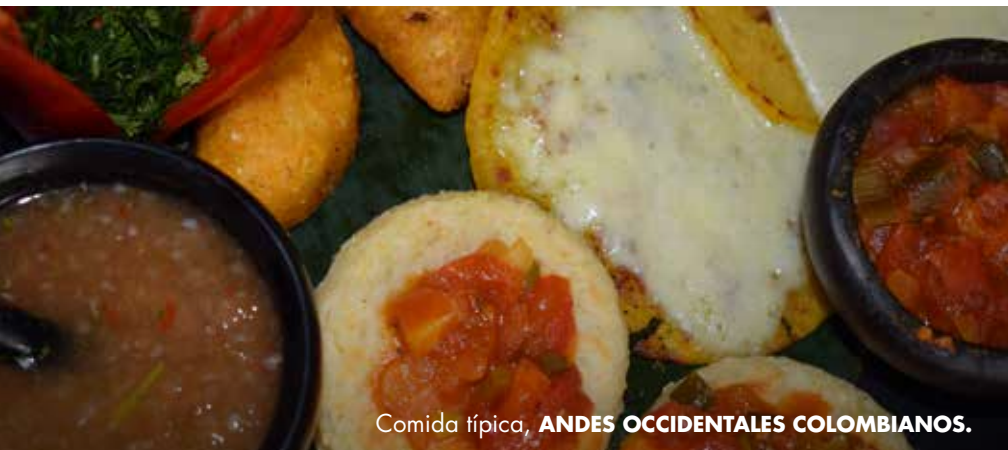
Comida típica, ANDES OCCIDENTALES COLOMBIANOS.