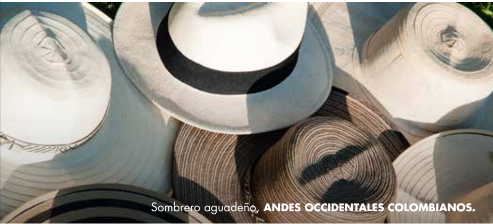
Sombrero aguadeño, ANDES OCCIDENTALES COLOMBIANOS.