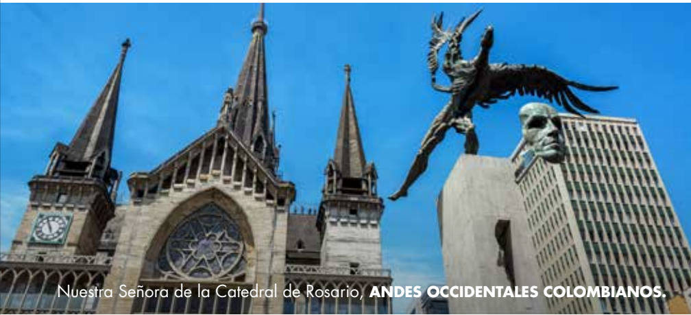
Nuestra Señora de la Catedral de Rosario, ANDES OCCIDENTALES COLOMBIANOS.

El corcho neirano, las colaciones de Supía, el sombrero aguadeño.