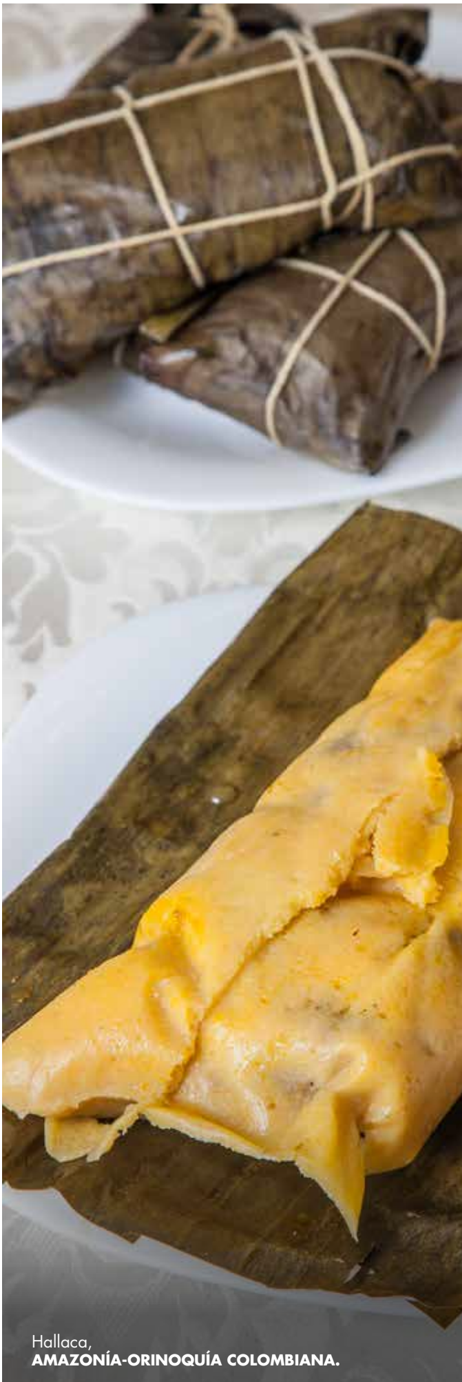
Hallaca, AMAZONÍA-ORINOQUÍA COLOMBIANA.

Su cercanía con Venezuela le permite compartir la gastronomía con el país vecino. Sobresalen preparaciones como las hallacas, pisillo de chigüiro, arepa venezolana, los tumbos y la sopa de picadillo de carne seca. En sus recetas emplean animales de monte o exóticos propios de la llanura como el venado, chigüiro, el cerdo de monte, chicamo, galápago, babilla.