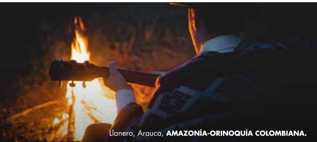
Llanero, Arauca, AMAZONÍA-ORINOQUÍA COLOMBIANA.

Personajes que representan históricamente la valentía que identifica al llanero.