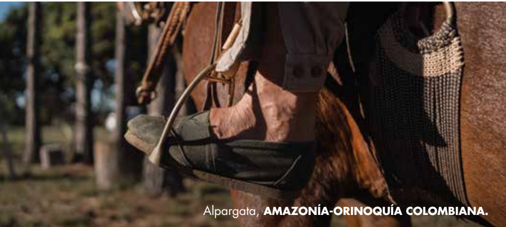
Alpargata, AMAZONÍA-ORINOQUÍA COLOMBIANA.

Refleja la cotidianidad del llanero araucano y su versatilidad para domar el ganado.