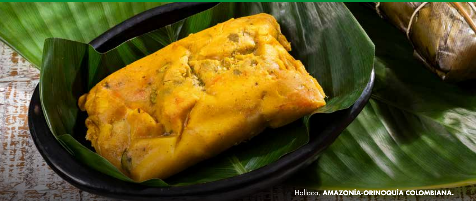
Hallaca, AMAZONÍA-ORINOQUÍA COLOMBIANA.