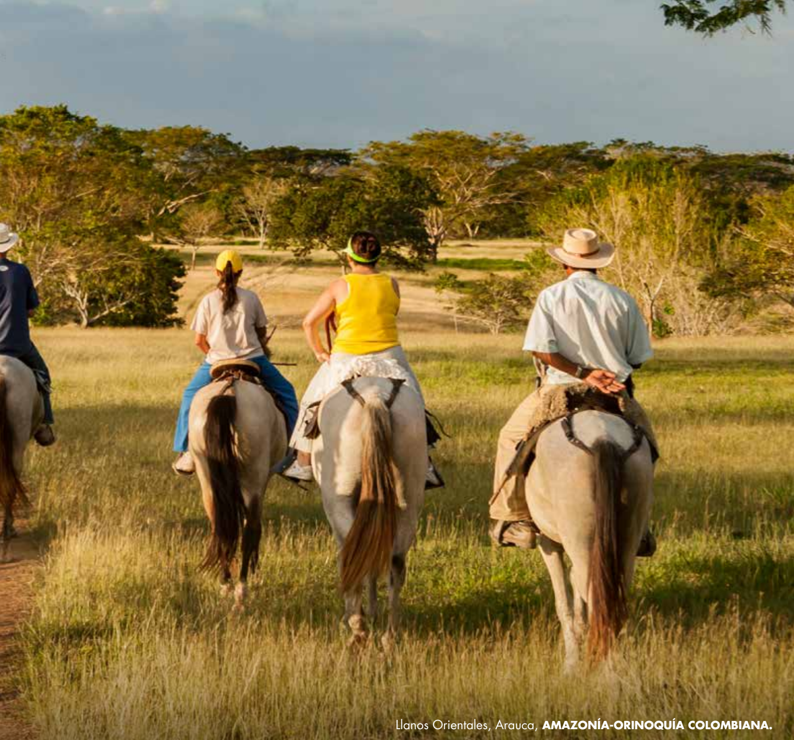
Llanos Orientales, Arauca, AMAZONÍA-ORINOQUÍA COLOMBIANA.

En su memoria permanecen las hazañas de los antepasados, que transportaban ganado por toda la Orinoquía, en viajes que podían tardar hasta mes y medio. Por ello, en la cultura popular son vistos como los representantes del auténtico llanero.