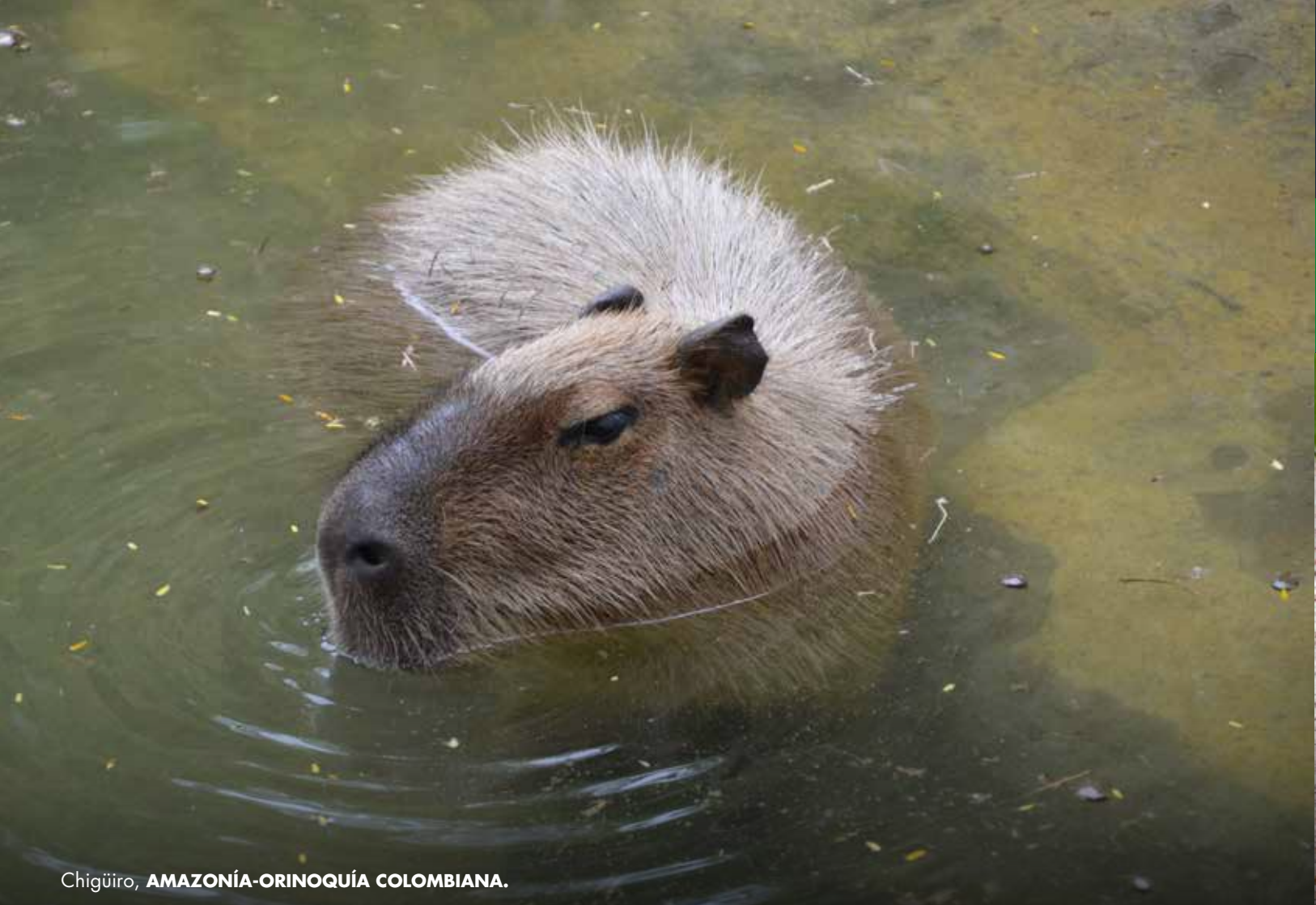
Chigüiro, AMAZONÍA-ORINOQUÍA COLOMBIANA.