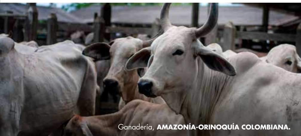
Ganadería, AMAZONÍA-ORINOQUÍA COLOMBIANA.

Marca las relaciones entre dos naciones, culturas y pueblos.