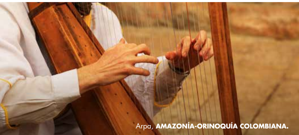
Arpa, AMAZONÍA-ORINOQUÍA COLOMBIANA.

La artesanía que representa al departamento.