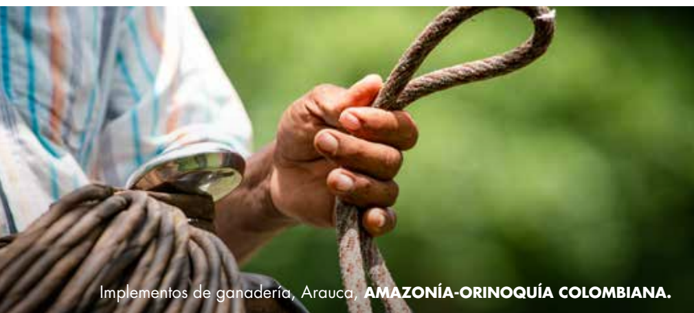
Implementos de ganadería, Arauca, AMAZONÍA-ORINOQUÍA COLOMBIANA.