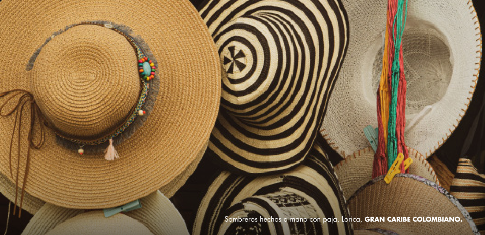
Sombreros hechos a mano con paja, Loricá, GRAN CARIBE COLOMBIANO .