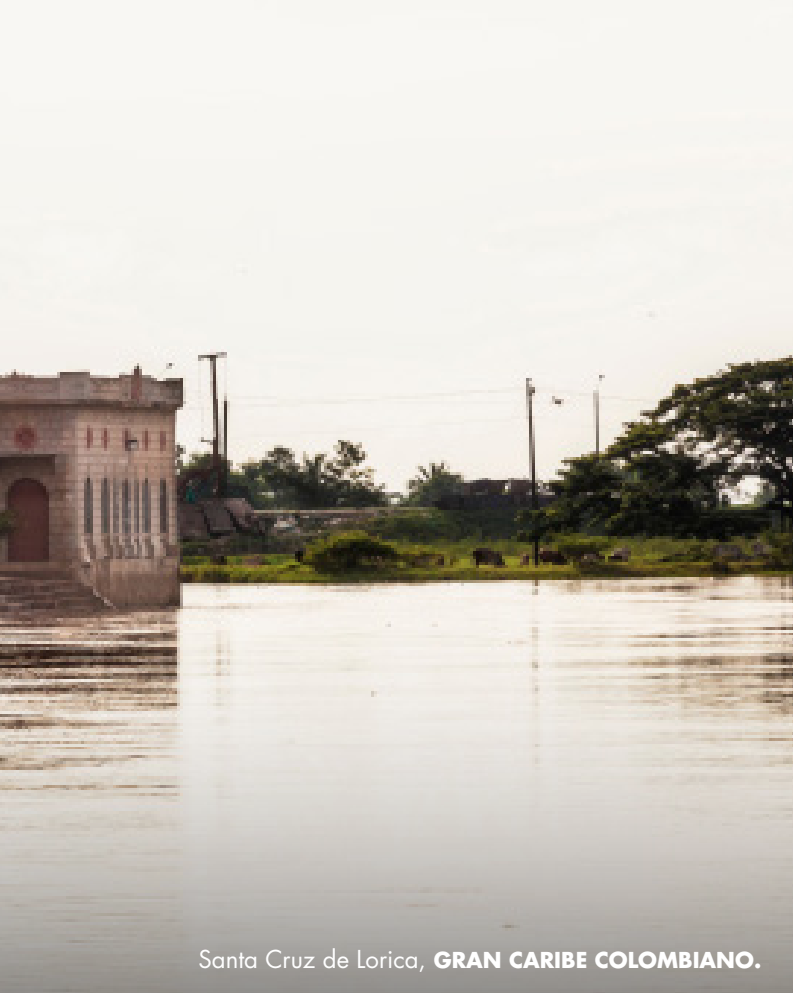
Santa Cruz de Lorica, GRAN CARIBE COLOMBIANO.

“Entonces, esa multiculturalidad producto de la mezcla que proviene también de la ancestralidad y de la penetración de diferentes culturas; El indígena con el español, el africano y los extranjeros provenientes de otros países. En este caso, los que mas pasaban eran los Sirios-libaneses, por eso se habla de que Córdoba tiene cuatro grandes herencias, atiende a los indígenas, españoles, africanos y Sirio-libaneses”.