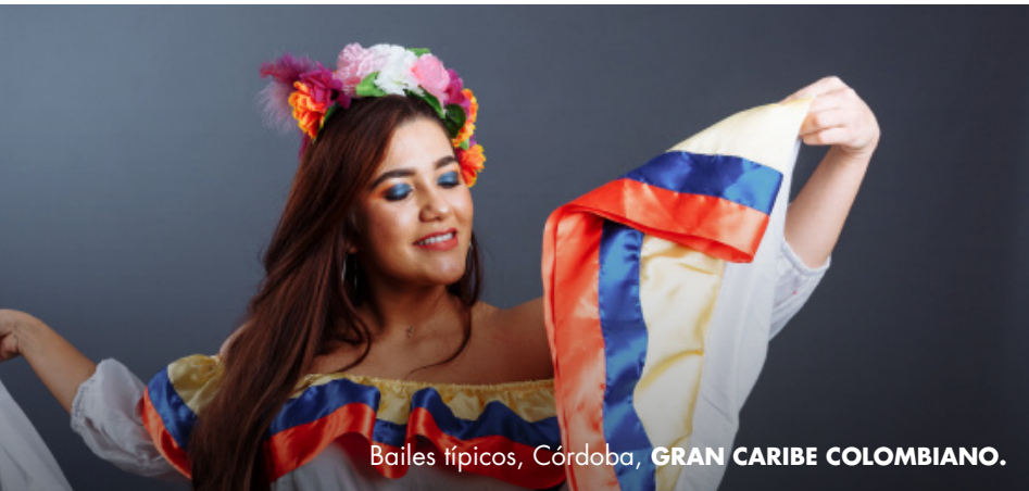
Bailes típicos, Córdoba, GRAN CARIBE COLOMBIANO.