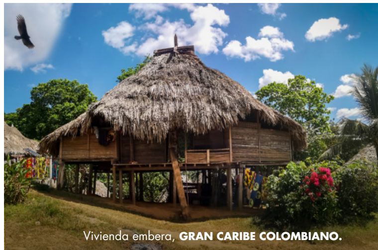
Vivienda embera, GRAN CARIBE COLOMBIANO.

En Córdoba se encuentran los palenques, símbolo de fuerza y resistencia. Por otro lado, la cultura negra entrega en Córdoba el bullerengue, baile que nace de los cantos palenqueros y está acompañado de cantoras, bailadoras y tamboreros.