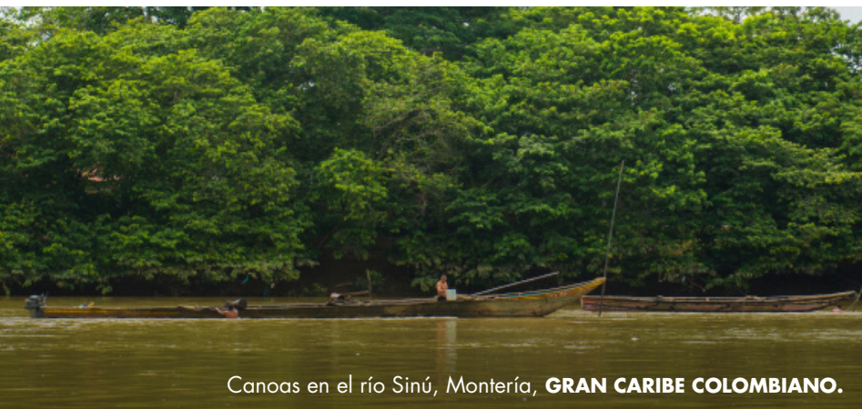
Canoas en el río Sinú, Montería, GRAN CARIBE COLOMBIANO.

Un territorio de tradiciones y de historia que permanece en su arquitectura. Es un lugar en el que la literatura es relevante en tanto aporta fuerza y riqueza a la mezcla.