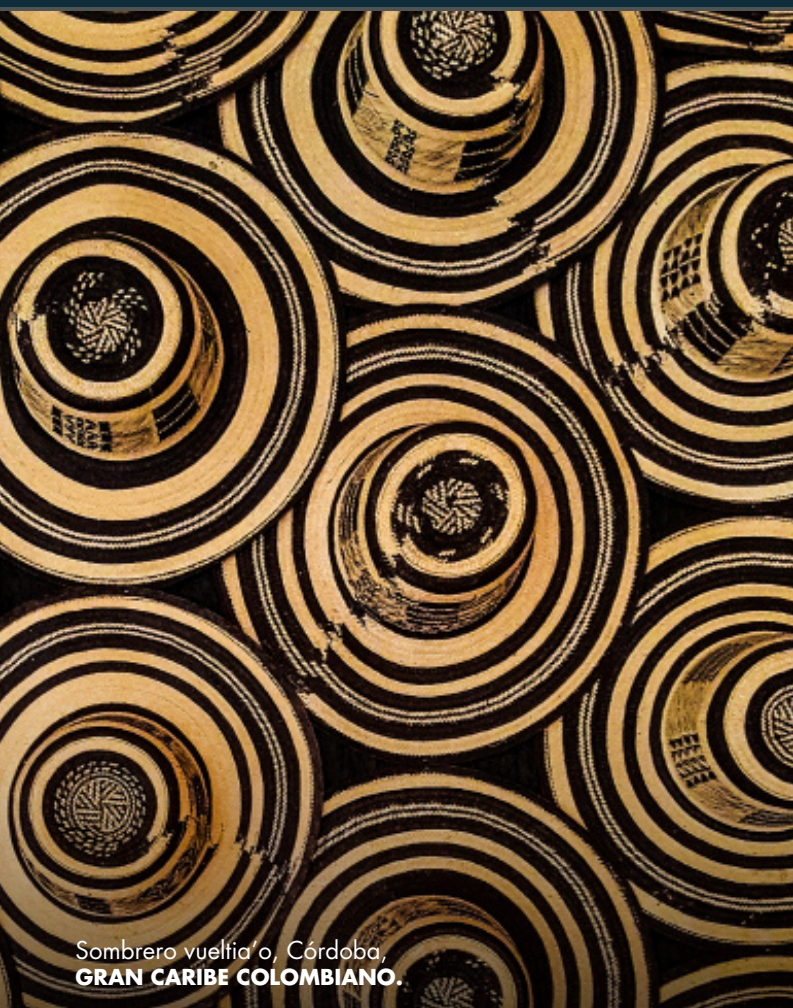
Sombrero vueltiao, Córdoba, GRAN CARIBE COLOMBIANO.