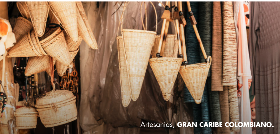
Artesanías, GRAN CARIBE COLOMBIANO.