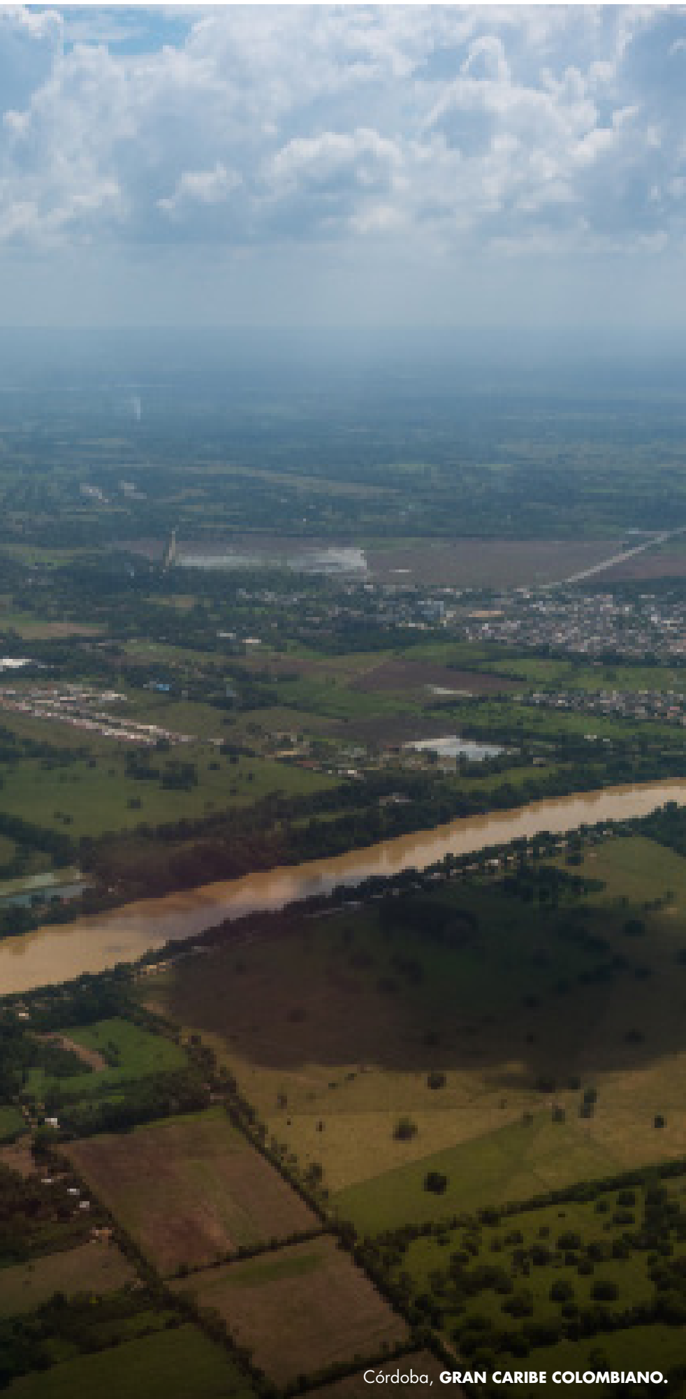
Córdoba, GRAN CARIBE COLOMBIANO.

Testimonios anónimos revelan que “la cordillera occidental muere aquí, en el Nudo de Paramillo, y ahí se dividen tres serranías: Ayapel, San Jerónimo y Abibe. Todas entran al departamento, teniendo una serie de colinas y cerros que también le varían el paisaje. Esto hace que en nuestra orilla de mar no tengamos playas arenosas como Coveñas, sino acantilados más pequeños. Hay playas, pero también muchos acantilados pequeños, porque encuentras la montaña y el mar. Esto es otro paisaje, la gente no está acostumbrada, porque piensa en costa, y piensa en playas” .