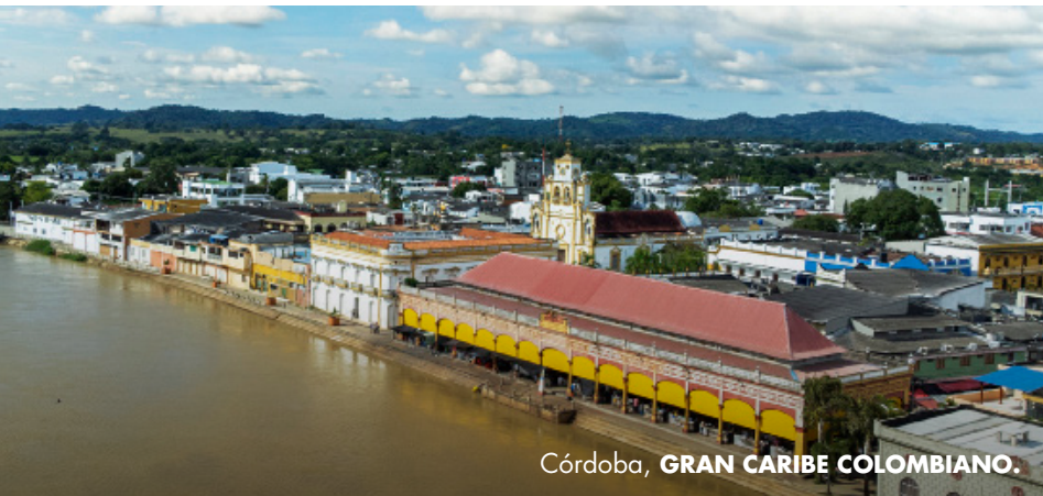
Córdoba, GRAN CARIBE COLOMBIANO.

Sus creaciones en caña flecha, especialmente el sombrero vueltaio representan al cordobés. Este accesorio se convierte en una extensión más de su cuerpo, es el que lo acompaña y lo cuida del sol.